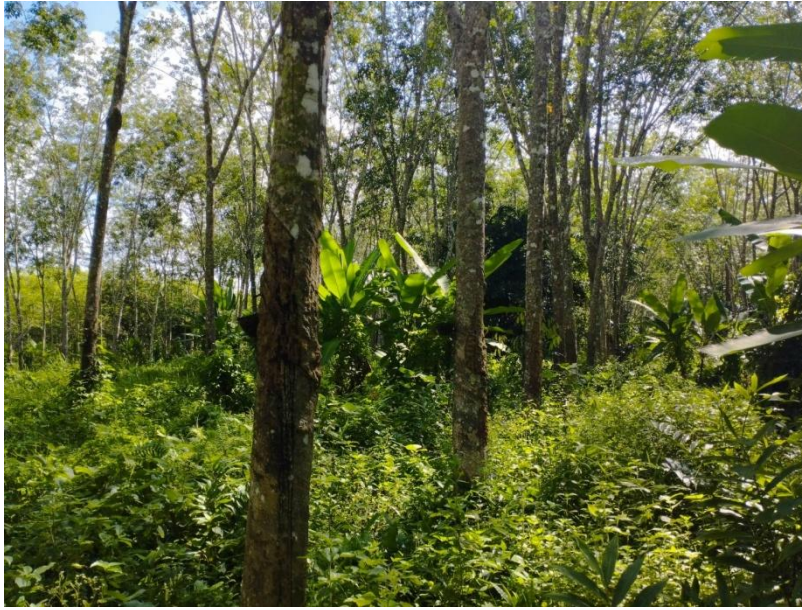
ภาพที่ 1 : ลักษณะสวนยางพารา SFC 0828 จังหวัดสงขลา