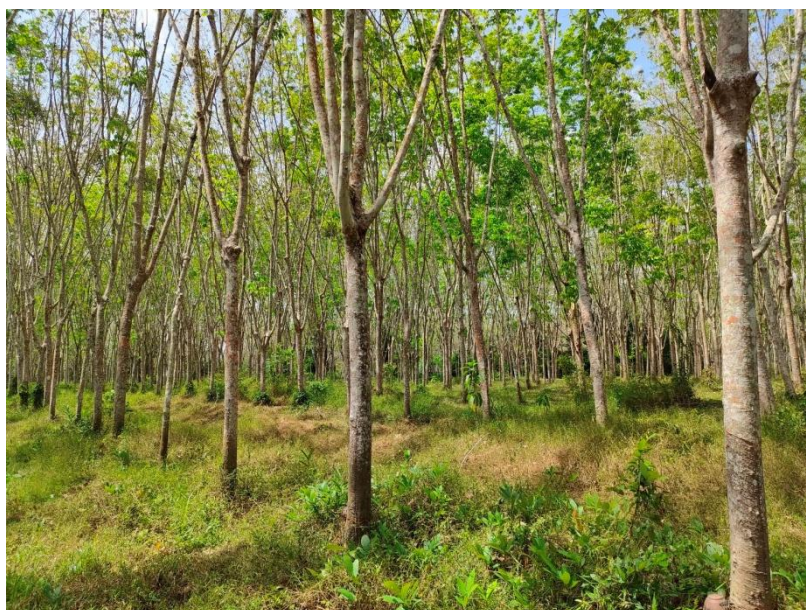
ภาพที่ 1 : ลักษณะสวนยางพารา SFC 0850 จังหวัดสงขลา

ผลการสำรวจความหลากหลายทางชีวภาพพรรณพืช บริเวณพื้นที่สวนยางพารา SFC 0850 จังหวัดสงขลา พบว่าเป็นสวนยางพารา(Genus) : Hevea สปีชีส์ (Species): brasiliensis ชื่อสามัญ (Common name) : para rubber ชื่อวิทยาศาสตร์ (Scientific name) : Hevea brasiliensis Mull-Arg. กระจายอยู่ทั่วไป (ภาพที่ 1)