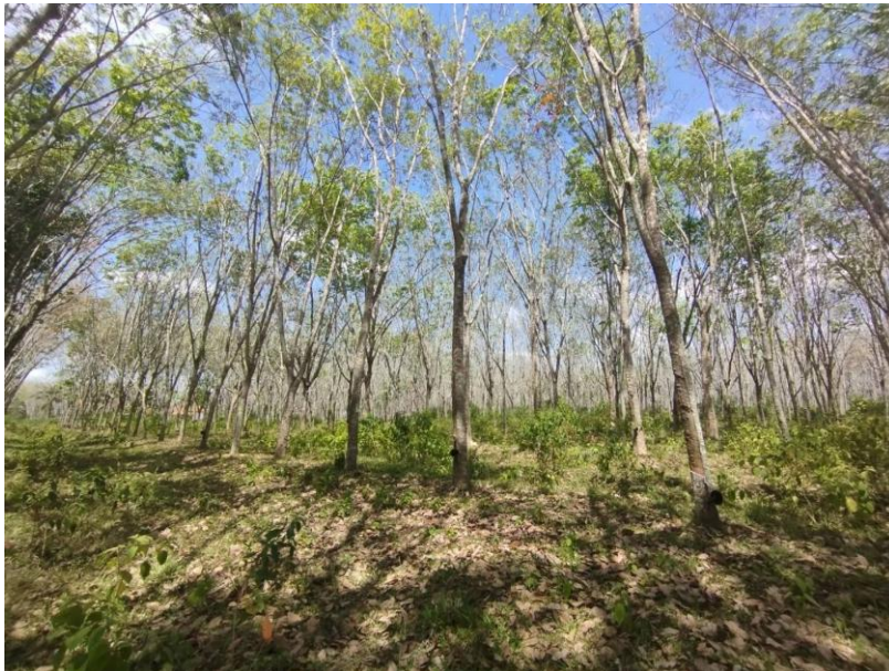
ภาพที่ 1 : ลักษณะสวนยางพารา SFC 0847 จังหวัดสงขลา

ผลการสำรวจความหลากหลายทางชีวภาพพรรณพืช บริเวณพื้นที่สวนยางพารา SFC 0847 จังหวัดสงขลา พบว่าเป็นสวนยางพารา(Genus) : Hevea สปีชีส์ (Species): brasiliensis ชื่อสามัญ (Common name) : para rubber ชื่อวิทยาศาสตร์ (Scientific name) : Hevea brasiliensis Mull-Arg. กระจายอยู่ทั่วไป (ภาพที่ 1)