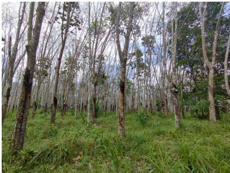
ภาพที่ 1 : ลักษณะสวนยางพารา SFC 0838 จังหวัดสงขลา

ผลการสำรวจความหลากหลายทางชีวภาพพรรณพืช บริเวณพื้นที่สวนยางพารา SFC 0838 จังหวัดสงขลา พบว่าเป็นสวนยางพารา(Genus) : Hevea สปีชีส์ (Species): brasiliensis ชื่อสามัญ (Common name) : para rubber ชื่อวิทยาศาสตร์ (Scientific name) : Hevea brasiliensis Mull-Arg. กระจายอยู่ทั่วไป (ภาพที่ 1)