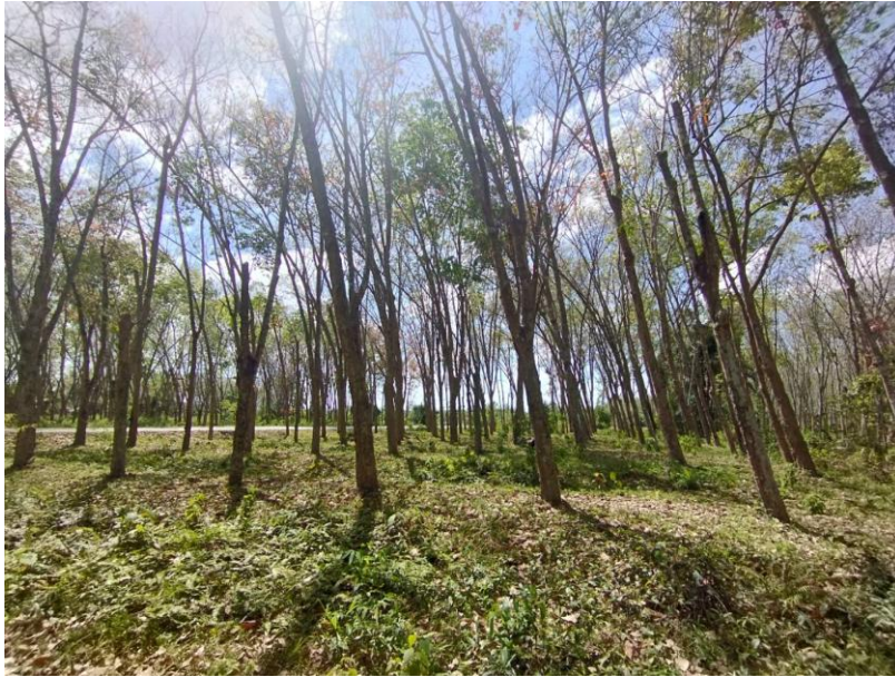
ภาพที่ 1 : ลักษณะสวนยางพารา SFC 0845 จังหวัดสงขลา

ผลการสำรวจความหลากหลายทางชีวภาพพรรณพืช บริเวณพื้นที่สวนยางพารา SFC 0845 จังหวัดสงขลา พบว่าเป็นสวนยางพารา(Genus) : Hevea สปีชีส์ (Species): brasiliensis ชื่อสามัญ (Common name) : para rubber ชื่อวิทยาศาสตร์ (Scientific name) : Hevea brasiliensis Mull-Arg. กระจายอยู่ทั่วไป (ภาพที่ 1)