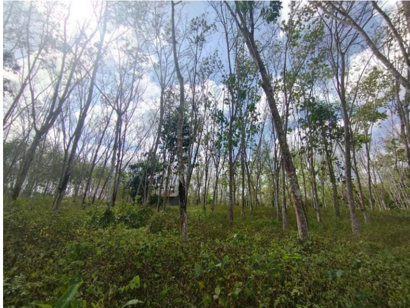
ภาพที่ 1 : ลักษณะสวนยางพารา SFC 0843 จังหวัดสงขลา