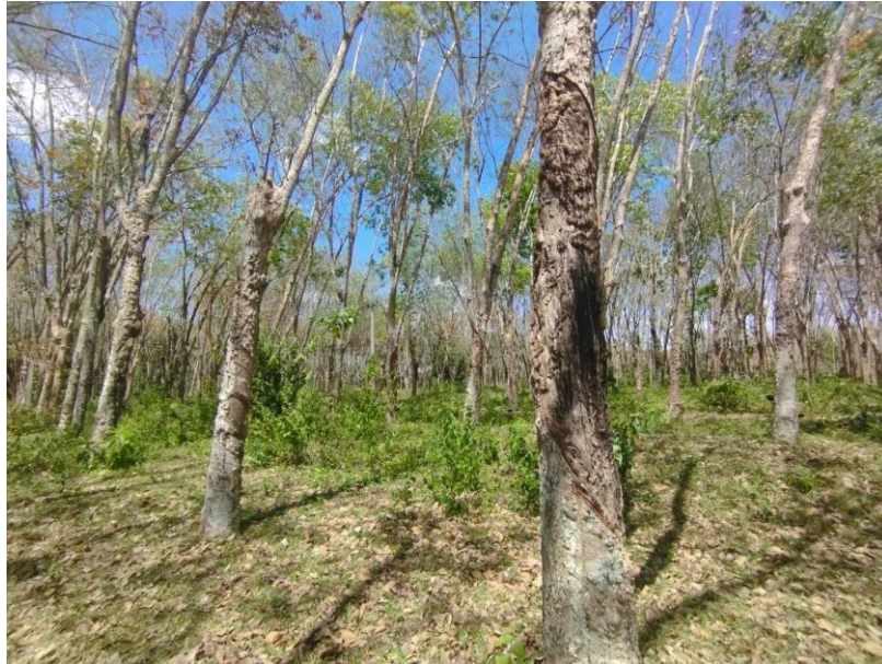
ภาพที่ 1 : ลักษณะสวนยางพารา SFC 0846 จังหวัดสงขลา

ผลการสำรวจความหลากหลายทางชีวภาพพรรณพืช บริเวณพื้นที่สวนยางพารา SFC 0846 จังหวัดสงขลา พบว่าเป็นสวนยางพารา(Genus) : Hevea สปีชีส์ (Species): brasiliensis ชื่อสามัญ (Common name) : para rubber ชื่อวิทยาศาสตร์ (Scientific name) : Hevea brasiliensis Mull-Arg. กระจายอยู่ทั่วไป (ภาพที่ 1)