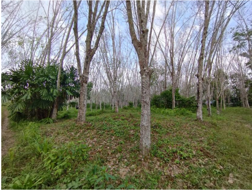
ภาพที่ 1 : ลักษณะสวนยางพารา SFC 0851 จังหวัดสงขลา