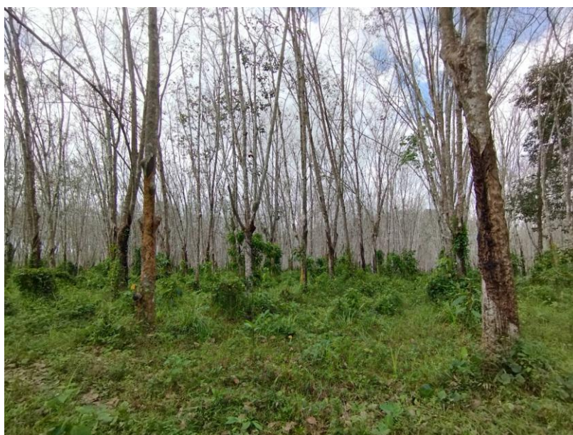
ภาพที่ 1 : ลักษณะสวนยางพารา SFC 0839 จังหวัดสงขลา

ผลการสำรวจความหลากหลายทางชีวภาพพรรณพืช บริเวณพื้นที่สวนยางพารา SFC 0839 จังหวัดสงขลา พบว่าเป็นสวนยางพารา(Genus) : Hevea สปีชีส์ (Species): brasiliensis ชื่อสามัญ (Common name) : para rubber ชื่อวิทยาศาสตร์ (Scientific name) : Hevea brasiliensis Mull-Arg. กระจายอยู่ทั่วไปแปลง (ภาพที่ 1)