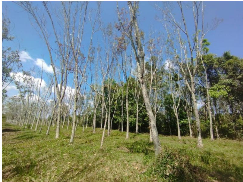
ภาพที่ 1 : ลักษณะสวนยางพารา SFC 0842 จังหวัดสงขลา

ผลการสำรวจความหลากหลายทางชีวภาพพรรณพืช บริเวณพื้นที่สวนยางพารา SFC 0842 จังหวัดสงขลา พบว่าเป็นสวนยางพารา(Genus) : Hevea สปีชีส์ (Species): brasiliensis ชื่อสามัญ (Common name) : para rubber ชื่อวิทยาศาสตร์ (Scientific name) : Hevea brasiliensis Mull-Arg. กระจายอยู่ทั่วไป (ภาพที่ 1)