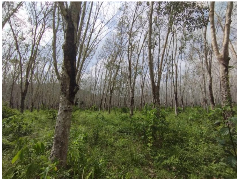
ภาพที่ 1 : ลักษณะสวนยางพารา SFC 0836 จังหวัดสงขลา

ผลการสำรวจความหลากหลายทางชีวภาพพรรณพืช บริเวณพื้นที่สวนยางพารา SFC 0836 จังหวัดสงขลา พบว่าเป็นสวนยางพารา(Genus) : Hevea สปีชีส์ (Species): brasiliensis ชื่อสามัญ (Common name) : para rubber ชื่อวิทยาศาสตร์ (Scientific name) : Hevea brasiliensis Mull-Arg. กระจายอยู่ทั่วไป (ภาพที่ 1)