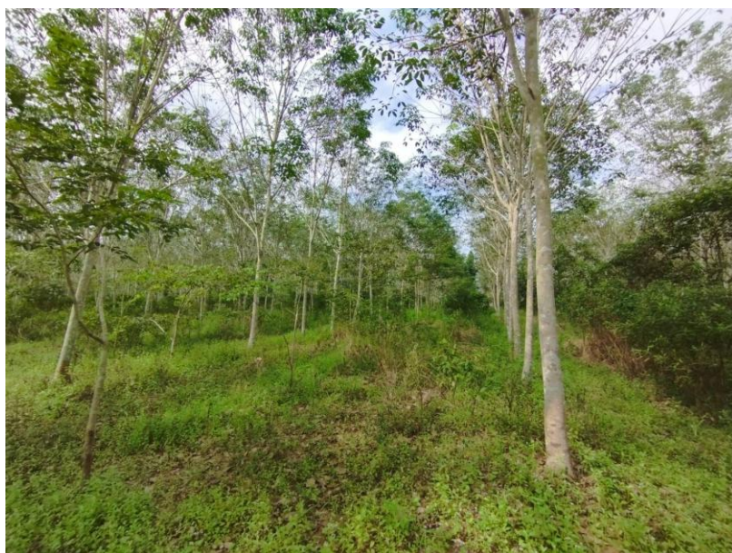
ภาพที่ 1 : ลักษณะสวนยางพารา SFC 0830 จังหวัดสงขลา

ผลการสำรวจความหลากหลายทางชีวภาพพรรณพืช บริเวณพื้นที่สวนยางพารา SFC 0830 จังหวัดสงขลา พบว่าเป็นสวนยางพารา(Genus) : Hevea สปีชีส์ (Species): brasiliensis ชื่อสามัญ (Common name) : para rubber ชื่อวิทยาศาสตร์ (Scientific name) : Hevea brasiliensis Mull-Arg. กระจายอยู่ทั่วไป (ภาพที่ 1)