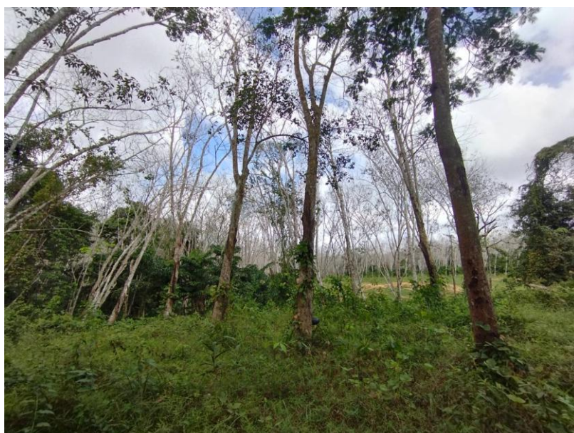
ภาพที่ 1 : ลักษณะสวนยางพารา SFC 0840 จังหวัดสงขลา

ผลการสำรวจความหลากหลายทางชีวภาพพรรณพืช บริเวณพื้นที่สวนยางพารา SFC 0840 จังหวัดสงขลา พบว่าเป็นสวนยางพารา(Genus) : Hevea สปีชีส์ (Species): brasiliensis ชื่อสามัญ (Common name) : para rubber ชื่อวิทยาศาสตร์ (Scientific name) : Hevea brasiliensis Mull-Arg. กระจายอยู่ทั่วไป (ภาพที่ 1)