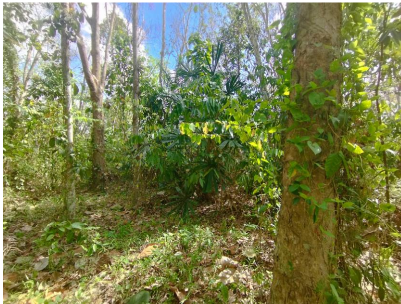
ภาพที่ 1 : ลักษณะสวนยางพารา SFC 0834 จังหวัดสงขลา

ผลการสำรวจความหลากหลายทางชีวภาพพรรณพืช บริเวณพื้นที่สวนยางพารา SFC 0834 จังหวัดสงขลา พบว่าเป็นสวนยางพารา(Genus) : Hevea สปีชีส์ (Species): brasiliensis ชื่อสามัญ (Common name) : para rubber ชื่อวิทยาศาสตร์ (Scientific name) : Hevea brasiliensis Mull-Arg. กระจายอยู่ทั่วไป (ภาพที่ 1)