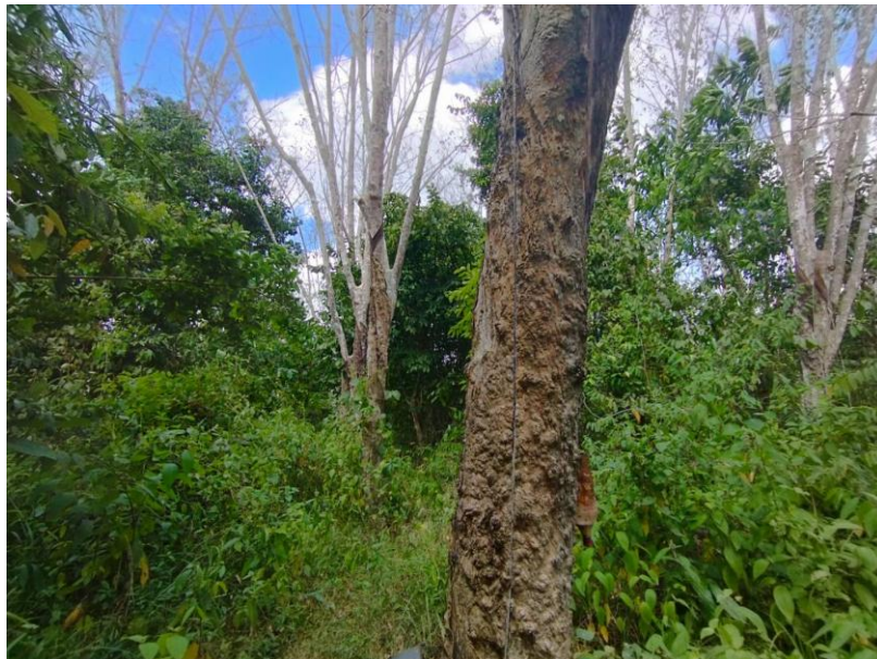
ภาพที่ 1 : ลักษณะสวนยางพารา SFC 0835 จังหวัดสงขลา

ผลการสำรวจความหลากหลายทางชีวภาพพรรณพืช บริเวณพื้นที่สวนยางพารา SFC 0835 จังหวัดสงขลา พบว่าเป็นสวนยางพารา(Genus) : Hevea สปีชีส์ (Species): brasiliensis ชื่อสามัญ (Common name) : para rubber ชื่อวิทยาศาสตร์ (Scientific name) : Hevea brasiliensis Mull-Arg. กระจายอยู่ทั่วไป (ภาพที่ 1)