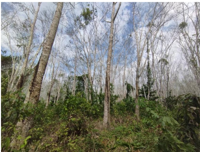
ภาพที่ 1 : ลักษณะสวนยางพารา SFC 0837 จังหวัดสงขลา

ผลการสำรวจความหลากหลายทางชีวภาพพรรณพืช บริเวณพื้นที่สวนยางพารา SFC 0837 จังหวัดสงขลา พบว่าเป็นสวนยางพารา(Genus) : Hevea สปีชีส์ (Species): brasiliensis ชื่อสามัญ (Common name) : para rubber ชื่อวิทยาศาสตร์ (Scientific name) : Hevea brasiliensis Mull-Arg. กระจายอยู่ทั่วไป (ภาพที่ 1)