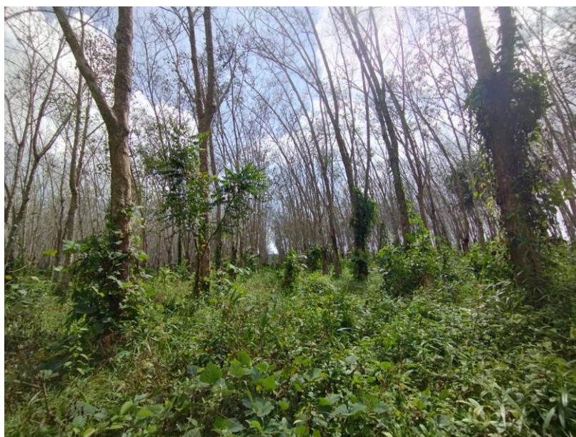
ภาพที่ 1 : ลักษณะสวนยางพารา SFC 0841 จังหวัดสงขลา

ผลการสำรวจความหลากหลายทางชีวภาพพรรณพืช บริเวณพื้นที่สวนยางพารา SFC 0841 จังหวัดสงขลา พบว่าเป็นสวนยางพารา(Genus) : Hevea สปีชีส์ (Species): brasiliensis ชื่อสามัญ (Common name) : para rubber ชื่อวิทยาศาสตร์ (Scientific name) : Hevea brasiliensis Mull-Arg. กระจายอยู่ทั่วไป (ภาพที่ 1)