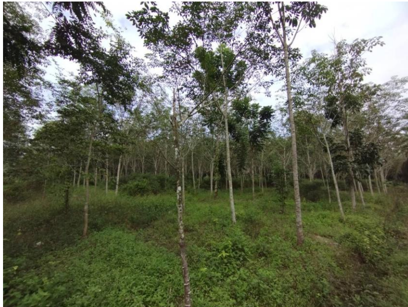
ภาพที่ 1 : ลักษณะสวนยางพารา SFC 0829 จังหวัดสงขลา

ผลการสำรวจความหลากหลายทางชีวภาพพรรณพืช บริเวณพื้นที่สวนยางพารา SFC 0829 จังหวัดสงขลา พบว่าเป็นสวนยางพารา(Genus) : Hevea สปีชีส์ (Species): brasiliensis ชื่อสามัญ (Common name) : para rubber ชื่อวิทยาศาสตร์ (Scientific name) : Hevea brasiliensis Mull-Arg. กระจายอยู่ทั่วไป (ภาพที่ 1)