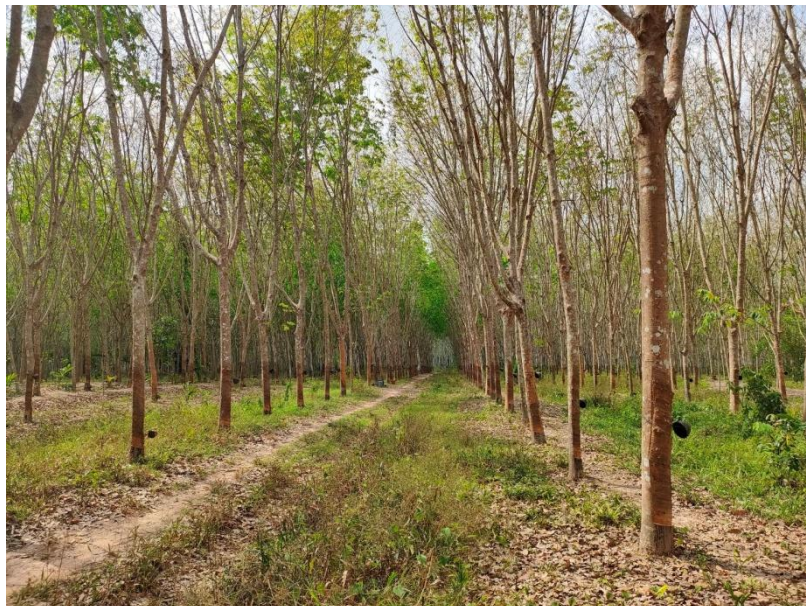
ภาพที่ 1 : ลักษณะสวนยางพารา SFC 0849 จังหวัดสงขลา

ผลการสำรวจความหลากหลายทางชีวภาพพรรณพืช บริเวณพื้นที่สวนยางพารา SFC 0849 จังหวัดสงขลา พบว่าเป็นสวนยางพารา(Genus) : Hevea สปีชีส์ (Species): brasiliensis ชื่อสามัญ (Common name) : para rubber ชื่อวิทยาศาสตร์ (Scientific name) : Hevea brasiliensis Mull-Arg. กระจายอยู่ทั่วไป (ภาพที่ 1)