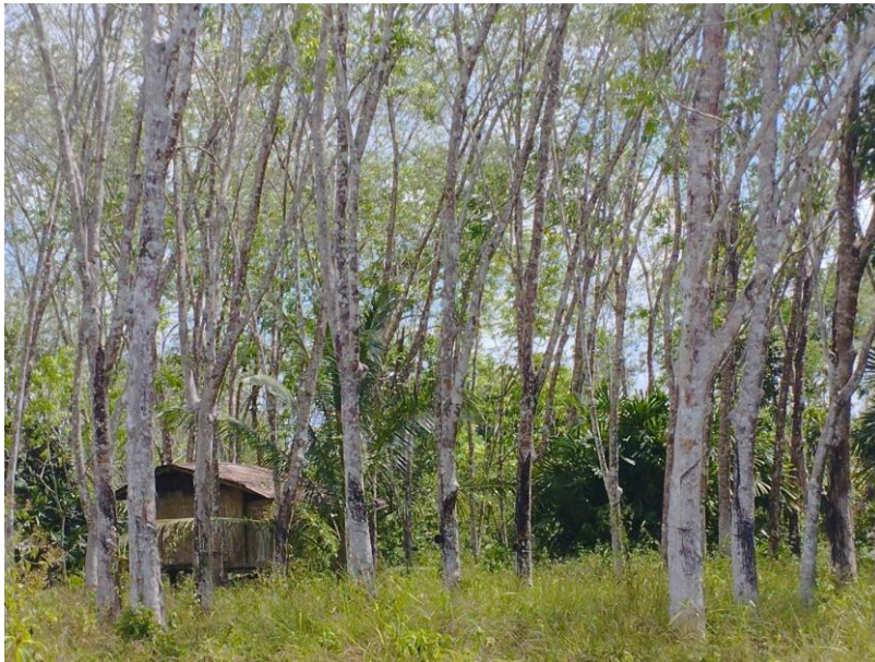
ภาพที่ 1 : ลักษณะสวนยางพารา SFC 0844 จังหวัดสงขลา

ผลการสำรวจความหลากหลายทางชีวภาพพรรณพืช บริเวณพื้นที่สวนยางพารา SFC 0844 จังหวัดสงขลา พบว่าเป็นสวนยางพารา(Genus) : Hevea สปีชีส์ (Species): brasiliensis ชื่อสามัญ (Common name) : para rubber ชื่อวิทยาศาสตร์ (Scientific name) : Hevea brasiliensis Mull-Arg. กระจายอยู่ทั่วไป (ภาพที่ 1)