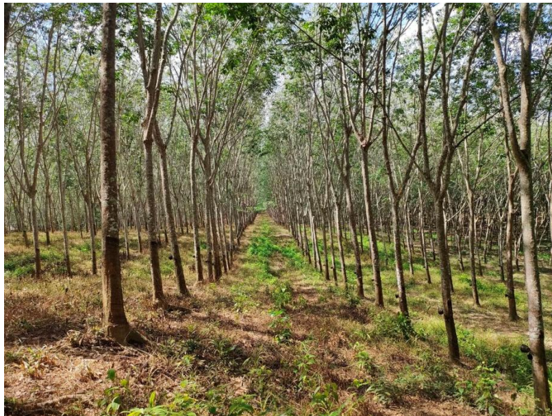
ภาพที่ 1 : ลักษณะสวนยางพารา SFC 0794 จังหวัดสงขลา

ผลการสำรวจความหลากหลายทางชีวภาพพรรณพืช บริเวณพื้นที่สวนยางพารา SFC 0794 จังหวัดสงขลา พบว่าเป็นสวนยางพารา(Genus) : Hevea สปีชีส์ (Species): brasiliensis ชื่อสามัญ (Common name) : para rubber ชื่อวิทยาศาสตร์ (Scientific name) : Hevea brasiliensis Mull-Arg. กระจายอยู่ทั่วไป (ภาพที่ 1)