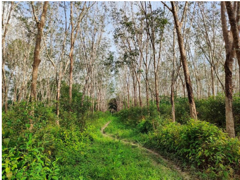
ภาพที่ 1 : ลักษณะสวนยางพารา SFC 0805 จังหวัดสงขลา

ผลการสำรวจความหลากหลายทางชีวภาพพรรณพืช บริเวณพื้นที่สวนยางพารา SFC 0805 จังหวัดสงขลา พบว่าเป็นสวนยางพารา(Genus) : Hevea สปีชีส์ (Species): brasiliensis ชื่อสามัญ (Common name) : para rubber ชื่อวิทยาศาสตร์ (Scientific name) : Hevea brasiliensis Mull-Arg. กระจายอยู่ทั่วไป (ภาพที่ 1)