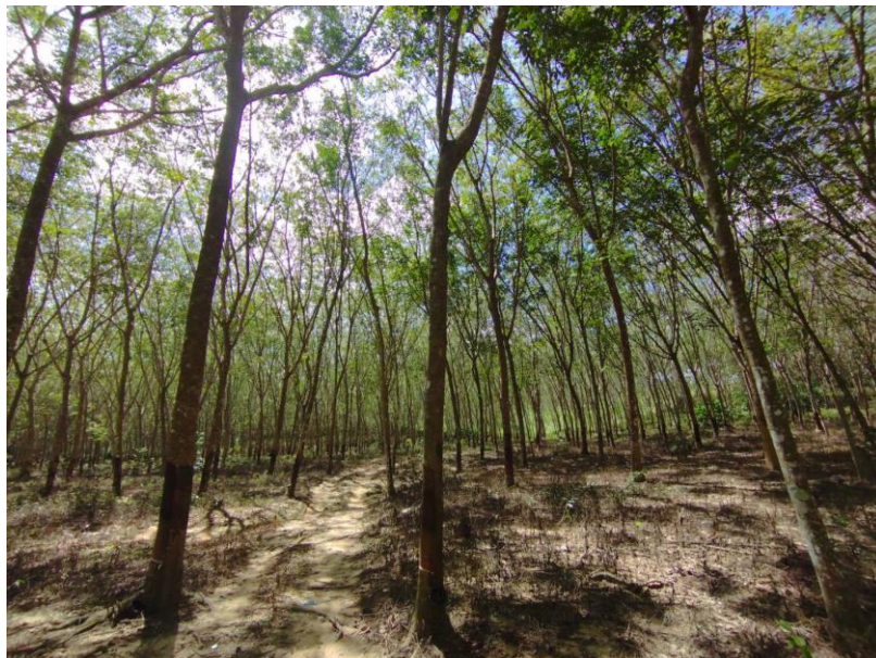
ภาพที่ 1 : ลักษณะสวนยางพารา SFC 0796 จังหวัดสงขลา

ผลการสำรวจความหลากหลายทางชีวภาพพรรณพืช บริเวณพื้นที่สวนยางพารา SFC 0796 จังหวัดสงขลา พบว่าเป็นสวนยางพารา(Genus) : Hevea สปีชีส์ (Species): brasiliensis ชื่อสามัญ (Common name) : para rubber ชื่อวิทยาศาสตร์ (Scientific name) : Hevea brasiliensis Mull-Arg. กระจายอยู่ทั่วไป (ภาพที่ 1)