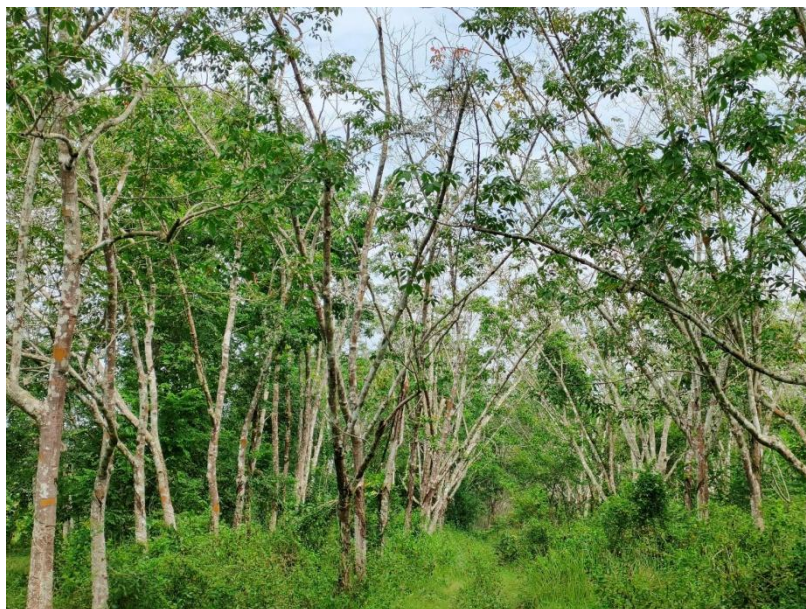
ภาพที่ 1 : ลักษณะสวนยางพารา SFC 0811 จังหวัดสงขลา

ผลการสำรวจความหลากหลายทางชีวภาพพรรณพืช บริเวณพื้นที่สวนยางพารา SFC 0811 จังหวัดสงขลา พบว่าเป็นสวนยางพารา(Genus) : Hevea สปีชีส์ (Species): brasiliensis ชื่อสามัญ (Common name) : para rubber ชื่อวิทยาศาสตร์ (Scientific name) : Hevea brasiliensis Mull-Arg. กระจายอยู่ทั่วไป (ภาพที่ 1)