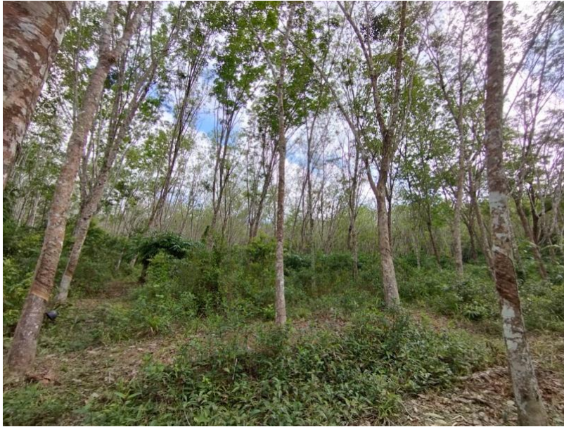
ภาพที่ 1 : ลักษณะสวนยางพารา SFC 0752 จังหวัดสงขลา

ผลการสำรวจความหลากหลายทางชีวภาพพรรณพืช บริเวณพื้นที่สวนยางพารา SFC 0752 จังหวัดสงขลา พบว่าเป็นสวนยางพารา(Genus) : Hevea สปีชีส์ (Species): brasiliensis ชื่อสามัญ (Common name) : para rubber ชื่อวิทยาศาสตร์ (Scientific name) : Hevea brasiliensis Mull-Arg. กระจายอยู่ทั่วไป (ภาพที่ 1)