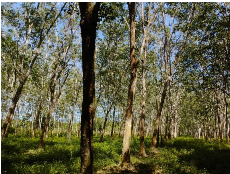
ภาพที่ 1 : ลักษณะสวนยางพารา SFC 0798 จังหวัดสงขลา

ผลการสำรวจความหลากหลายทางชีวภาพพรรณพืช บริเวณพื้นที่สวนยางพารา SFC 0798 จังหวัดสงขลา พบว่าเป็นสวนยางพารา(Genus) : Hevea สปีชีส์ (Species): brasiliensis ชื่อสามัญ (Common name) : para rubber ชื่อวิทยาศาสตร์ (Scientific name) : Hevea brasiliensis Mull-Arg. กระจายอยู่ทั่วไป (ภาพที่ 1)