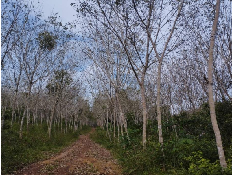
ภาพที่ 1 : ลักษณะสวนยางพารา SFC 0804 จังหวัดสงขลา