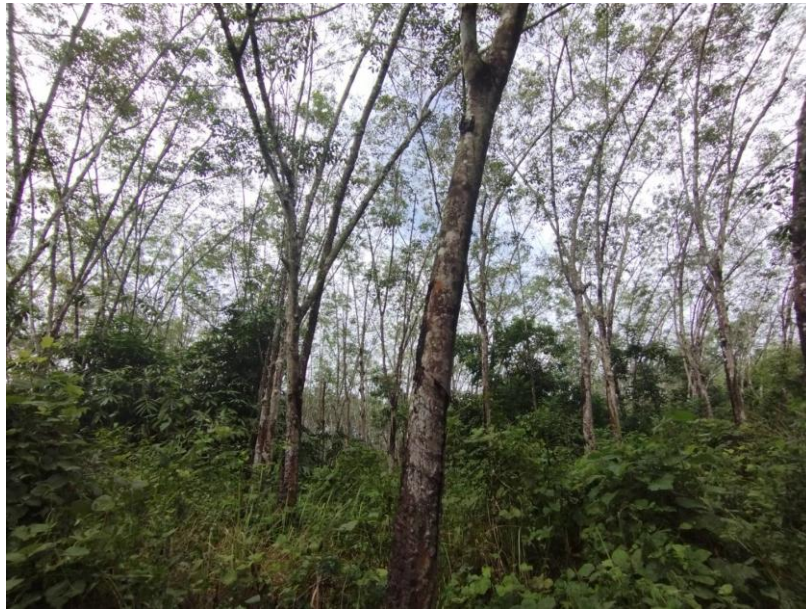
ภาพที่ 1 : ลักษณะสวนยางพารา SFC 0809 จังหวัดสงขลา

ผลการสำรวจความหลากหลายทางชีวภาพพรรณพืช บริเวณพื้นที่สวนยางพารา SFC 0809 จังหวัดสงขลา พบว่าเป็นสวนยางพารา(Genus) : Hevea สปีชีส์ (Species): brasiliensis ชื่อสามัญ (Common name) : para rubber ชื่อวิทยาศาสตร์ (Scientific name) : Hevea brasiliensis Mull-Arg. กระจายอยู่ทั่วไป (ภาพที่ 1)