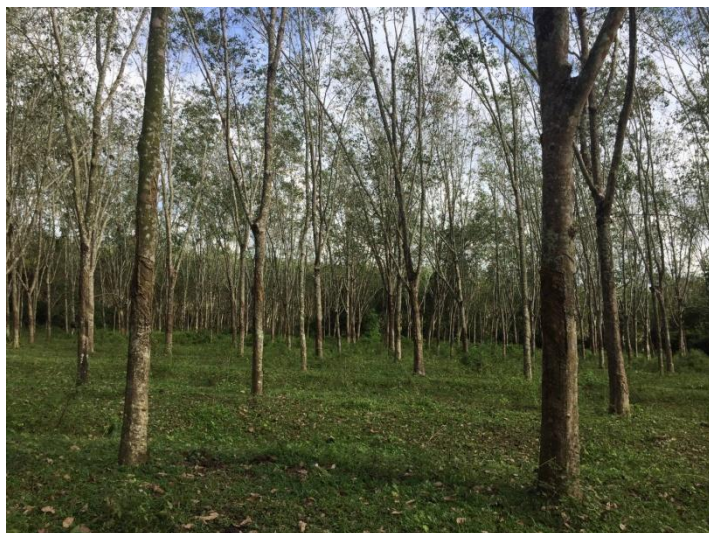
ภาพที่ 1 : ลักษณะสวนยางพารา SFC 0749 จังหวัดสงขลา