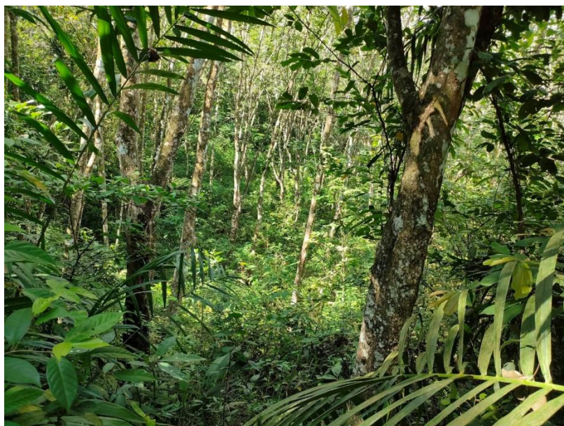
ภาพที่ 1 : ลักษณะสวนยางพารา SFC 0775 จังหวัดสงขลา

ผลการสำรวจความหลากหลายทางชีวภาพพรรณพืช บริเวณพื้นที่สวนยางพารา SFC 0775 จังหวัดสงขลา พบว่าเป็นสวนยางพารา(Genus) : Hevea สปีชีส์ (Species): brasiliensis ชื่อสามัญ (Common name) : para rubber ชื่อวิทยาศาสตร์ (Scientific name) : Hevea brasiliensis Mull-Arg. กระจายอยู่ทั่วไป (ภาพที่ 1)