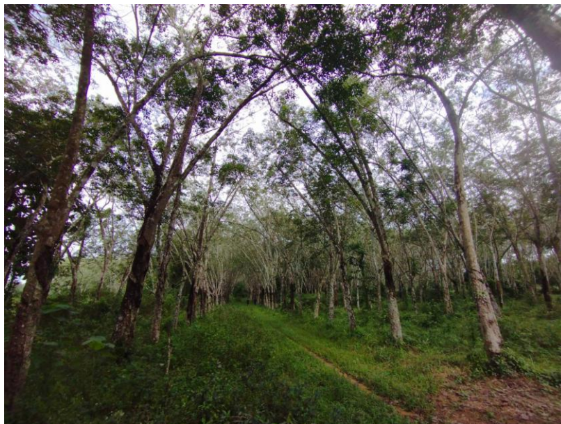
ภาพที่ 1 : ลักษณะสวนยางพารา SFC 0810 จังหวัดสงขลา

ผลการสำรวจความหลากหลายทางชีวภาพพรรณพืช บริเวณพื้นที่สวนยางพารา SFC 0810 จังหวัดสงขลา พบว่าเป็นสวนยางพารา(Genus) : Hevea สปีชีส์ (Species): brasiliensis ชื่อสามัญ (Common name) : para rubber ชื่อวิทยาศาสตร์ (Scientific name) : Hevea brasiliensis Mull-Arg. กระจายอยู่ทั่วไป (ภาพที่ 1)