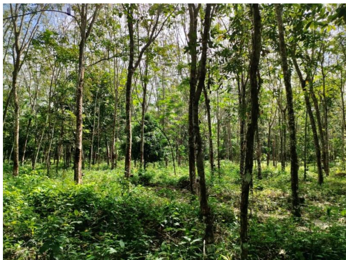
ภาพที่ 1 : ลักษณะสวนยางพารา SFC 0801 จังหวัดสงขลา