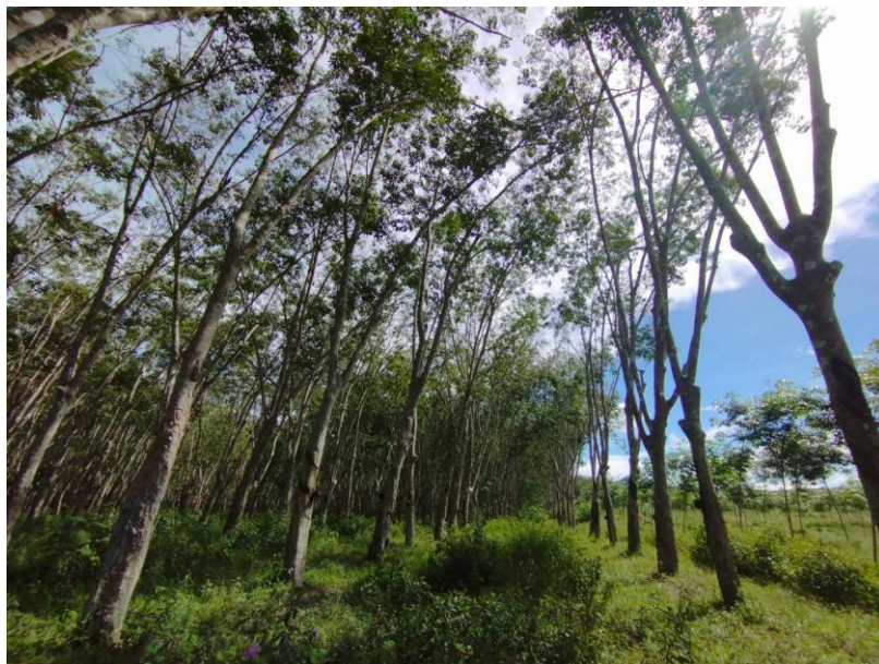
ภาพที่ 1 : ลักษณะสวนยางพารา SFC 0800 จังหวัดสงขลา

ผลการสำรวจความหลากหลายทางชีวภาพพรรณพืช บริเวณพื้นที่สวนยางพารา SFC 0800 จังหวัดสงขลา พบว่าเป็นสวนยางพารา(Genus) : Hevea สปีชีส์ (Species): brasiliensis ชื่อสามัญ (Common name) : para rubber ชื่อวิทยาศาสตร์ (Scientific name) : Hevea brasiliensis Mull-Arg. กระจายอยู่ทั่วไป (ภาพที่ 1)