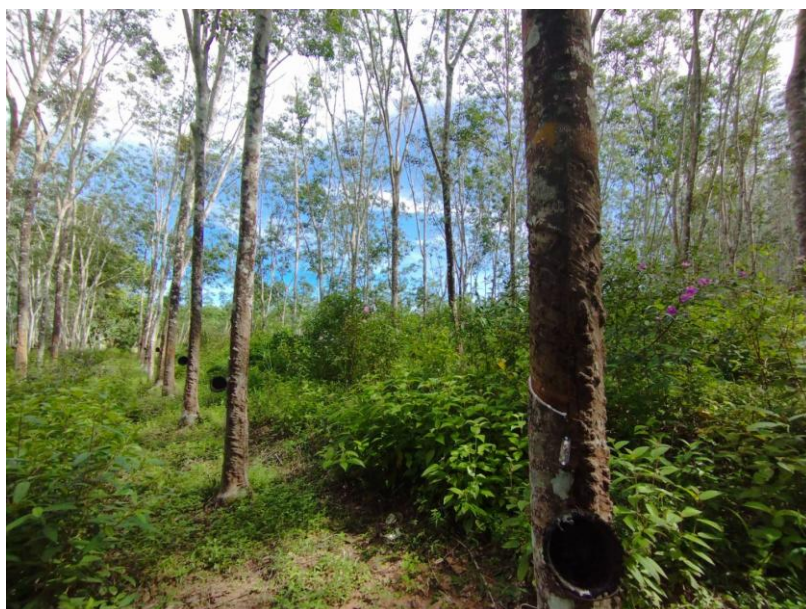
ภาพที่ 1 : ลักษณะสวนยางพารา SFC 0799 จังหวัดสงขลา

ผลการสำรวจความหลากหลายทางชีวภาพพรรณพืช บริเวณพื้นที่สวนยางพารา SFC 0799 จังหวัดสงขลา พบว่าเป็นสวนยางพารา(Genus) : Hevea สปีชีส์ (Species): brasiliensis ชื่อสามัญ (Common name) : para rubber ชื่อวิทยาศาสตร์ (Scientific name) : Hevea brasiliensis Mull-Arg. กระจายอยู่ทั่วไป (ภาพที่ 1)