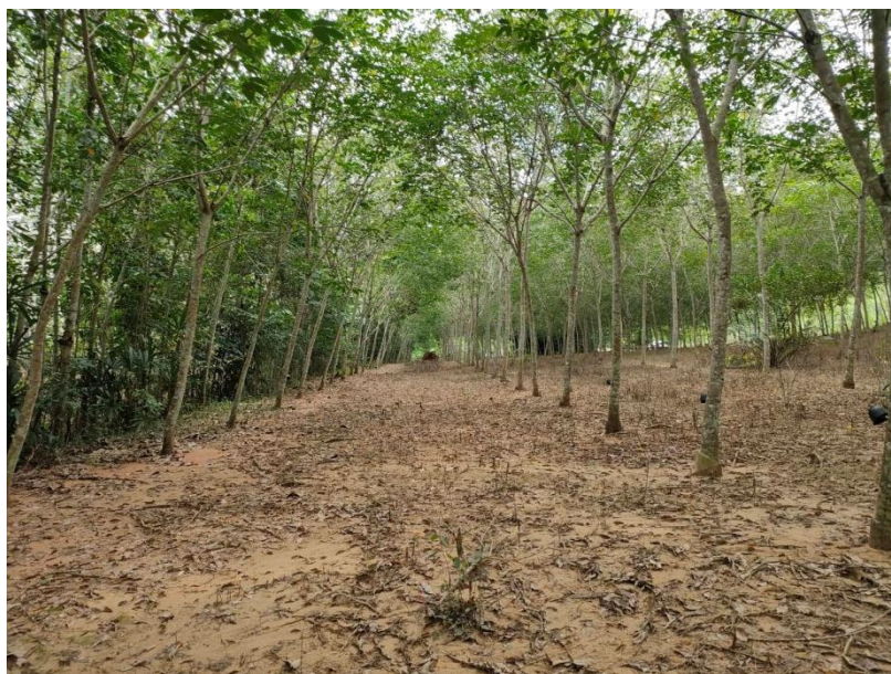
ภาพที่ 1 : ลักษณะสวนยางพารา SFC 0797 จังหวัดสงขลา

ผลการสำรวจความหลากหลายทางชีวภาพพรรณพืช บริเวณพื้นที่สวนยางพารา SFC 0797 จังหวัดสงขลา พบว่าเป็นสวนยางพารา(Genus) : Hevea สปีชีส์ (Species): brasiliensis ชื่อสามัญ (Common name) : para rubber ชื่อวิทยาศาสตร์ (Scientific name) : Hevea brasiliensis Mull-Arg. กระจายอยู่ทั่วไป (ภาพที่ 1)