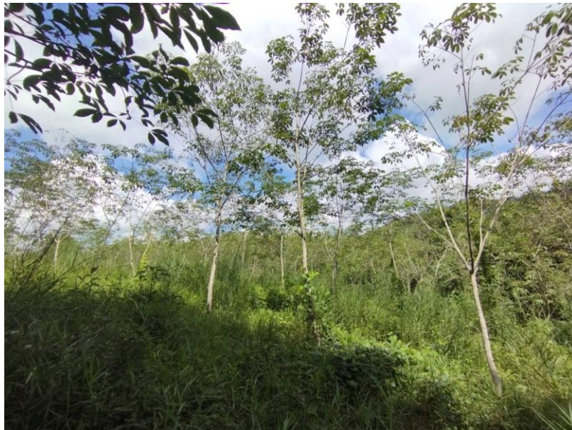
ภาพที่ 1 : ลักษณะสวนยางพารา SFC 0827 จังหวัดสงขลา

ผลการสำรวจความหลากหลายทางชีวภาพพรรณพืช บริเวณพื้นที่สวนยางพารา SFC 0827 จังหวัดสงขลา พบว่าเป็นสวนยางพารา(Genus) : Hevea สปีชีส์ (Species): brasiliensis ชื่อสามัญ (Common name) : para rubber ชื่อวิทยาศาสตร์ (Scientific name) : Hevea brasiliensis Mull-Arg. กระจายอยู่ทั่วไป (ภาพที่ 1)