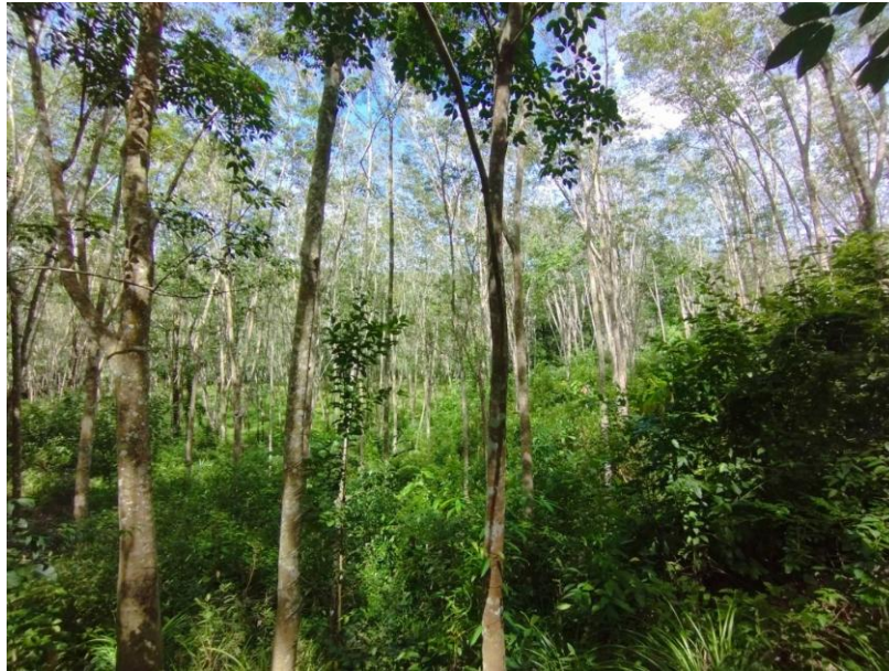
ภาพที่ 1 : ลักษณะสวนยางพารา SFC 0814 จังหวัดสงขลา

ผลการสำรวจความหลากหลายทางชีวภาพพรรณพืช บริเวณพื้นที่สวนยางพารา SFC 0814 จังหวัดสงขลา พบว่าเป็นสวนยางพารา(Genus) : Hevea สปีชีส์ (Species): brasiliensis ชื่อสามัญ (Common name) : para rubber ชื่อวิทยาศาสตร์ (Scientific name) : Hevea brasiliensis Mull-Arg. กระจายอยู่ทั่วไป (ภาพที่ 1)