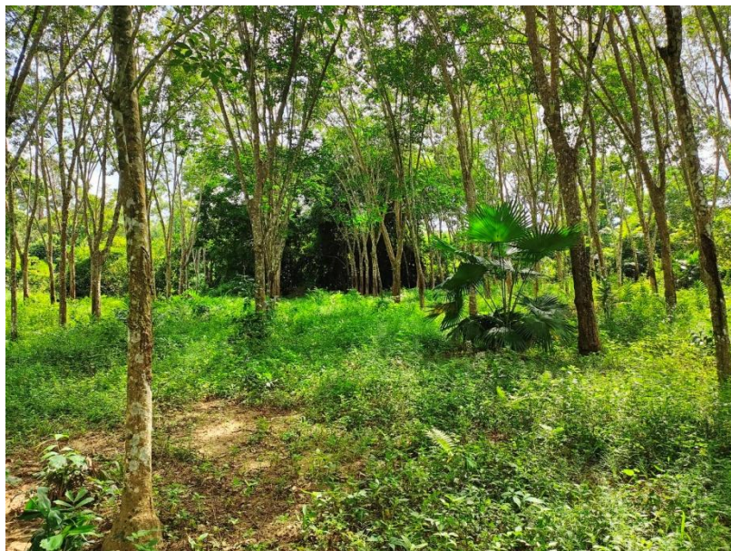
ภาพที่ 1 : ลักษณะสวนยางพารา SFC 0826 จังหวัดสงขลา

ผลการสำรวจความหลากหลายทางชีวภาพพรรณพืช บริเวณพื้นที่สวนยางพารา SFC 0826 จังหวัดสงขลา พบว่าเป็นสวนยางพารา(Genus) : Hevea สปีชีส์ (Species): brasiliensis ชื่อสามัญ (Common name) : para rubber ชื่อวิทยาศาสตร์ (Scientific name) : Hevea brasiliensis Mull-Arg. กระจายอยู่ทั่วไป (ภาพที่ 1)