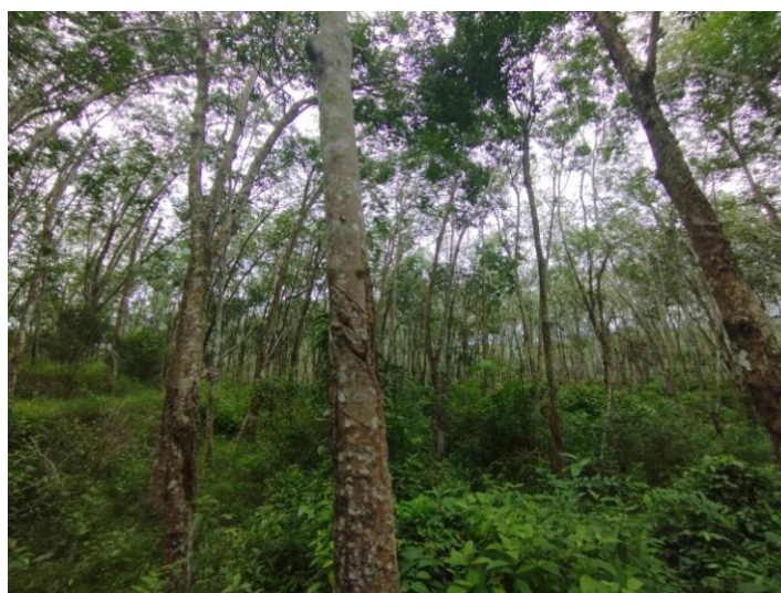
ภาพที่ 1 : ลักษณะสวนยางพารา SFC 0812 จังหวัดสงขลา

ผลการสำรวจความหลากหลายทางชีวภาพพรรณพืช บริเวณพื้นที่สวนยางพารา SFC 0812 จังหวัดสงขลา พบว่าเป็นสวนยางพารา(Genus) : Hevea สปีชีส์ (Species): brasiliensis ชื่อสามัญ (Common name) : para rubber ชื่อวิทยาศาสตร์ (Scientific name) : Hevea brasiliensis Mull-Arg. กระจายอยู่ทั่วไป (ภาพที่ 1)