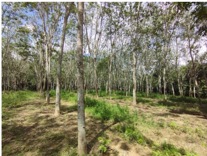
ภาพที่ 1 : ลักษณะสวนยางพารา SFC 0822 จังหวัดสงขลา

ผลการสำรวจความหลากหลายทางชีวภาพพรรณพืช บริเวณพื้นที่สวนยางพารา SFC 0822 จังหวัดสงขลา พบว่าเป็นสวนยางพารา(Genus) : Hevea สปีชีส์ (Species): brasiliensis ชื่อสามัญ (Common name) : para rubber ชื่อวิทยาศาสตร์ (Scientific name) : Hevea brasiliensis Mull-Arg. กระจายอยู่ทั่วไป (ภาพที่ 1)