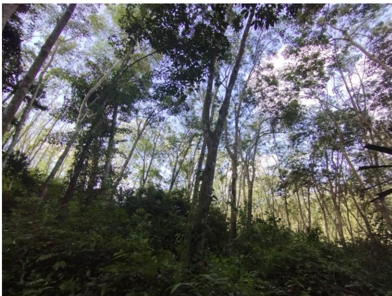
ภาพที่ 1 : ลักษณะสวนยางพารา SFC 0816 จังหวัดสงขลา