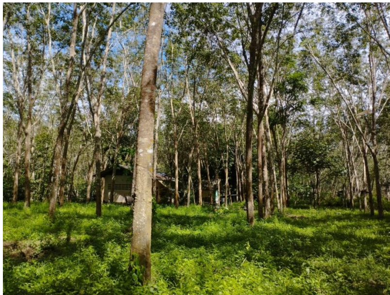
ภาพที่ 1 : ลักษณะสวนยางพารา SFC 0824 จังหวัดสงขลา

ผลการสำรวจความหลากหลายทางชีวภาพพรรณพืช บริเวณพื้นที่สวนยางพารา SFC 0824 จังหวัดสงขลา พบว่าเป็นสวนยางพารา (Genus) : Hevea สปีชีส์ (Species): brasiliensis ชื่อสามัญ (Common name) : para rubber ชื่อวิทยาศาสตร์ (Scientific name) : Hevea brasiliensis Mull-Arg. กระจายอยู่ทั่วไป (ภาพที่ 1)