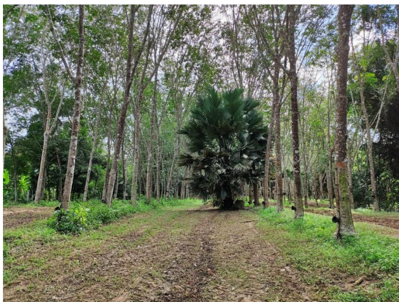
ภาพที่ 1 : ลักษณะสวนยางพารา SFC 0818 จังหวัดสงขลา

ผลการสำรวจความหลากหลายทางชีวภาพพรรณพืช บริเวณพื้นที่สวนยางพารา SFC 0818 จังหวัดสงขลา พบว่าเป็นสวนยางพารา(Genus) : Hevea สปีชีส์ (Species): brasiliensis ชื่อสามัญ (Common name) : para rubber ชื่อวิทยาศาสตร์ (Scientific name) : Hevea brasiliensis Mull-Arg. กระจายอยู่ทั่วไป (ภาพที่ 1)