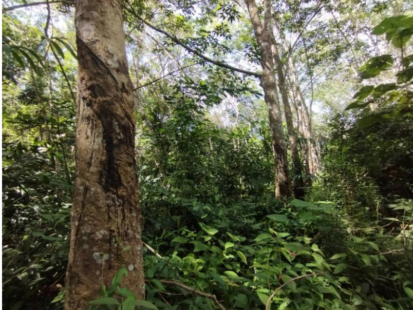
ภาพที่ 1 : ลักษณะสวนยางพารา SFC 0815 จังหวัดสงขลา