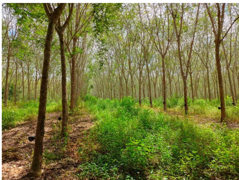
ภาพที่ 1 : ลักษณะสวนยางพารา SFC 0820 จังหวัดสงขลา

ผลการสำรวจความหลากหลายทางชีวภาพพรรณพืช บริเวณพื้นที่สวนยางพารา SFC 0820 จังหวัดสงขลา พบว่าเป็นสวนยางพารา(Genus) : Hevea สปีชีส์ (Species): brasiliensis ชื่อสามัญ (Common name) : para rubber ชื่อวิทยาศาสตร์ (Scientific name) : Hevea brasiliensis Mull-Arg. กระจายอยู่ทั่วไป (ภาพที่ 1)