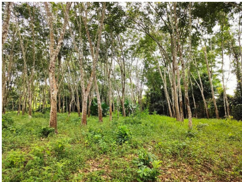
ภาพที่ 1 : ลักษณะสวนยางพารา SFC 0825 จังหวัดสงขลา

ผลการสำรวจความหลากหลายทางชีวภาพพรรณพืช บริเวณพื้นที่สวนยางพารา SFC 0825 จังหวัดสงขลา พบว่าเป็นสวนยางพารา(Genus) : Hevea สปีชีส์ (Species): brasiliensis ชื่อสามัญ (Common name) : para rubber ชื่อวิทยาศาสตร์ (Scientific name) : Hevea brasiliensis Mull-Arg. กระจายอยู่ทั่วไป (ภาพที่ 1)