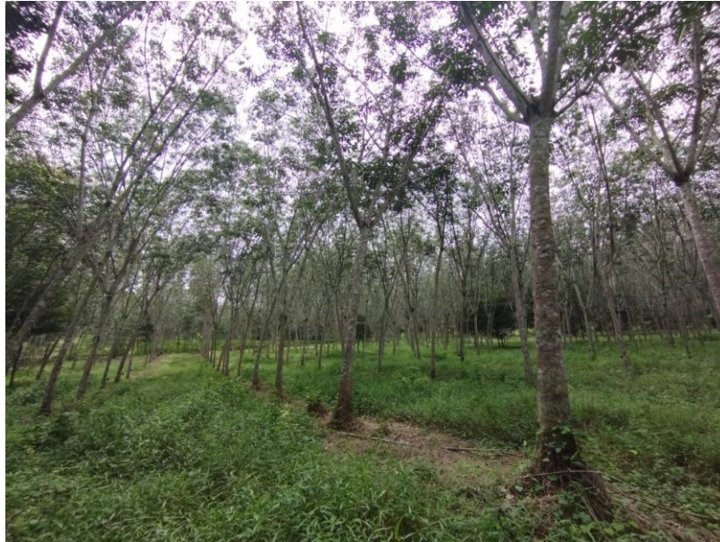
ภาพที่ 1 : ลักษณะสวนยางพารา SFC 0817 จังหวัดสงขลา

ผลการสำรวจความหลากหลายทางชีวภาพพรรณพืช บริเวณพื้นที่สวนยางพารา SFC 0817 จังหวัดสงขลา พบว่าเป็นสวนยางพารา(Genus) : Hevea สปีชีส์ (Species): brasiliensis ชื่อสามัญ (Common name) : para rubber ชื่อวิทยาศาสตร์ (Scientific name) : Hevea brasiliensis Mull-Arg. กระจายอยู่ทั่วไป (ภาพที่ 1)