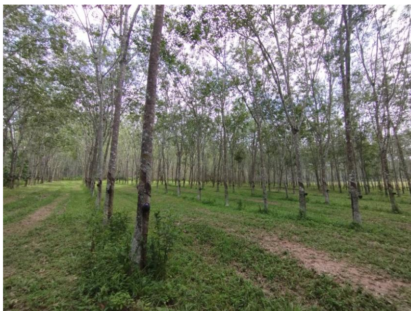
ภาพที่ 1 : ลักษณะสวนยางพารา SFC 0823 จังหวัดสงขลา

ผลการสำรวจความหลากหลายทางชีวภาพพรรณพืช บริเวณพื้นที่สวนยางพารา SFC 0823 จังหวัดสงขลา พบว่าเป็นสวนยางพารา(Genus) : Hevea สปีชีส์ (Species): brasiliensis ชื่อสามัญ (Common name) : para rubber ชื่อวิทยาศาสตร์ (Scientific name) : Hevea brasiliensis Mull-Arg. กระจายอยู่ทั่วไป (ภาพที่ 1)