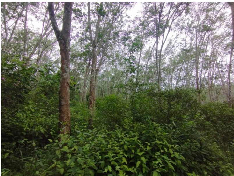
ภาพที่ 1 : ลักษณะสวนยางพารา SFC 0813 จังหวัดสงขลา