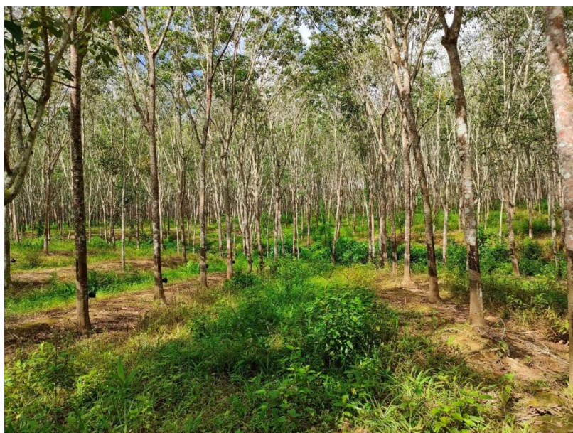
ภาพที่ 1 : ลักษณะสวนยางพารา SFC 0819 จังหวัดสงขลา

ผลการสำรวจความหลากหลายทางชีวภาพพรรณพืช บริเวณพื้นที่สวนยางพารา SFC 0819 จังหวัดสงขลา พบว่าเป็นสวนยางพารา(Genus) : Hevea สปีชีส์ (Species): brasiliensis ชื่อสามัญ (Common name) : para rubber ชื่อวิทยาศาสตร์ (Scientific name) : Hevea brasiliensis Mull-Arg. กระจายอยู่ทั่วไป (ภาพที่ 1)