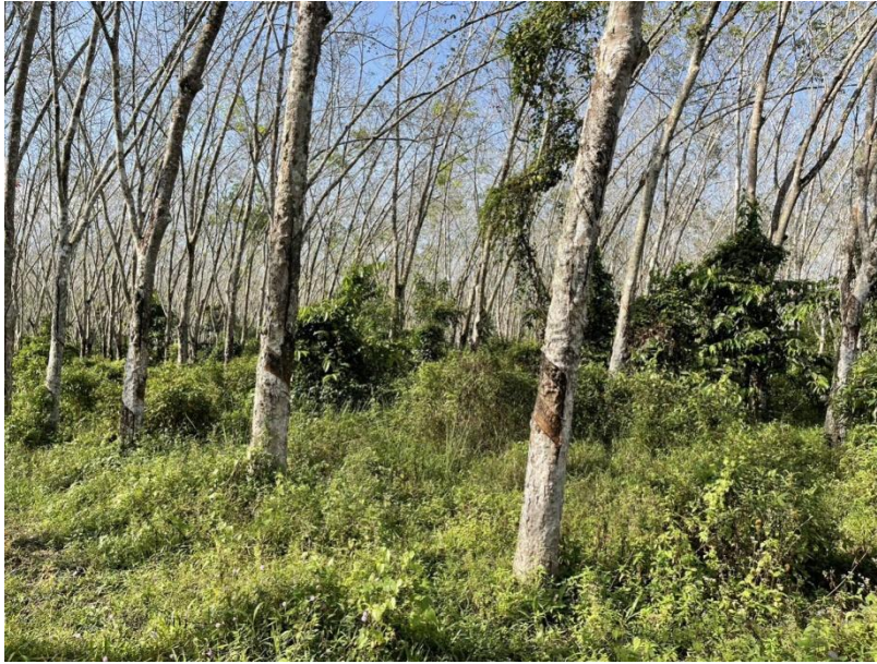
ภาพที่ 1 : ลักษณะสวนยางพารา SFC 0747 จังหวัดสงขลา