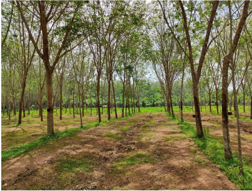
ภาพที่ 1 : ลักษณะสวนยางพารา SFC 0787 จังหวัดสงขลา