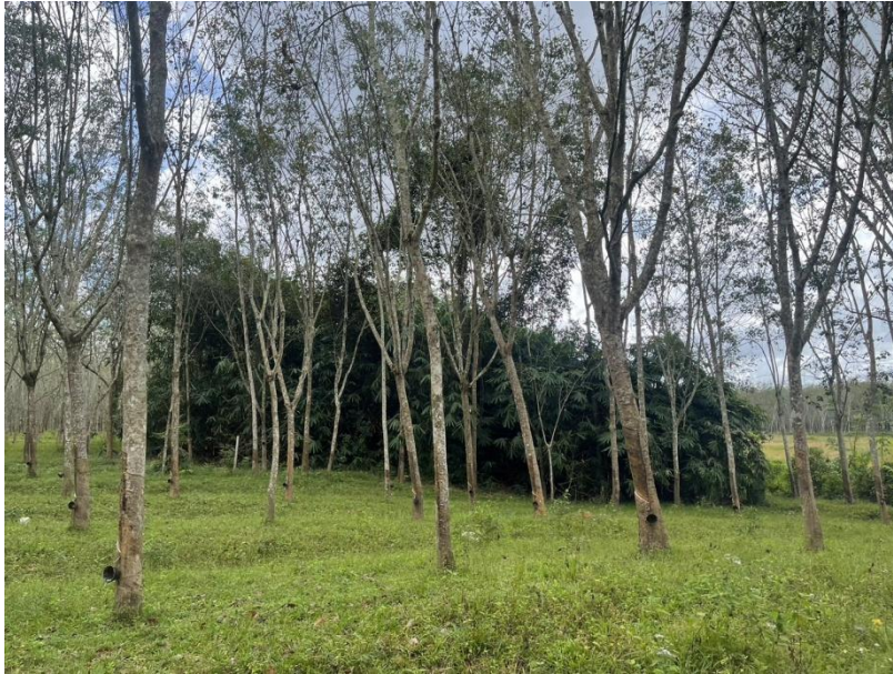
ภาพที่ 1 : ลักษณะสวนยางพารา SFC 0750 จังหวัดสงขลา