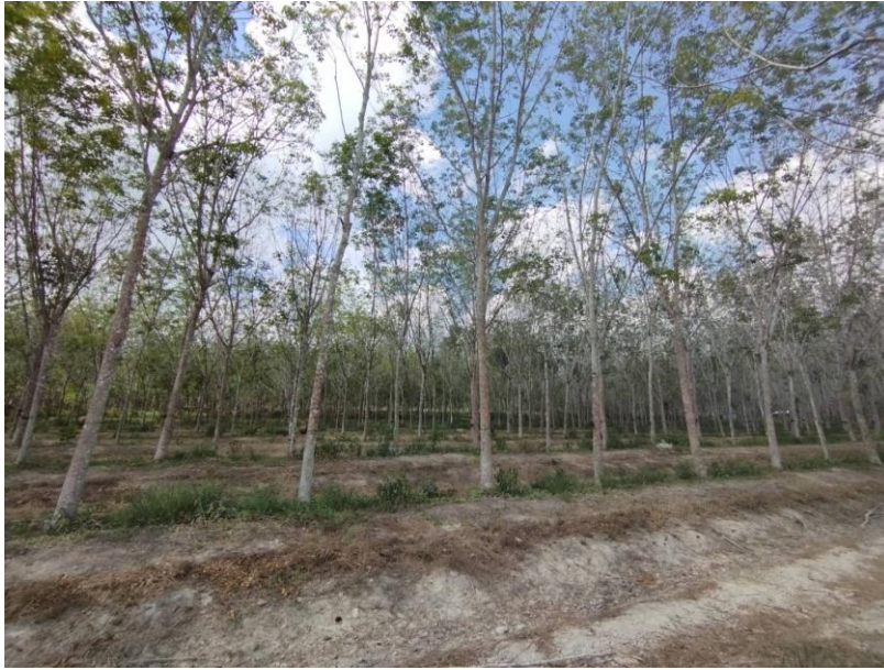
ภาพที่ 1 : ลักษณะสวนยางพารา SFC 0754 จังหวัดสงขลา