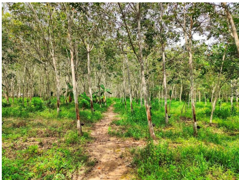
ภาพที่ 1 : ลักษณะสวนยางพารา SFC 0802 จังหวัดสงขลา

ผลการสำรวจความหลากหลายทางชีวภาพพรรณพืช บริเวณพื้นที่สวนยางพารา SFC 0802 จังหวัดสงขลา พบว่าเป็นสวนยางพารา(Genus) : Hevea สปีชีส์ (Species): brasiliensis ชื่อสามัญ (Common name) : para rubber ชื่อวิทยาศาสตร์ (Scientific name) : Hevea brasiliensis Mull-Arg. กระจายอยู่ทั่วไป (ภาพที่ 1)