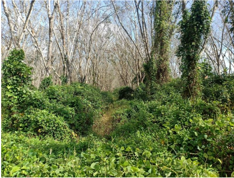
ภาพที่ 1 : ลักษณะสวนยางพารา SFC 0746 จังหวัดสงขลา