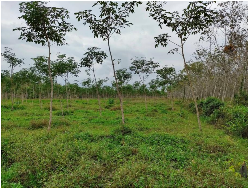
ภาพที่ 1 : ลักษณะสวนยางพารา SFC 0751 จังหวัดสงขลา

ผลการสำรวจความหลากหลายทางชีวภาพพรรณพืช บริเวณพื้นที่สวนยางพารา SFC 0751 จังหวัดสงขลา พบว่าเป็นสวนยางพารา(Genus) : Hevea สปีชีส์ (Species): brasiliensis ชื่อสามัญ (Common name) : para rubber ชื่อวิทยาศาสตร์ (Scientific name) : Hevea brasiliensis Mull-Arg. กระจายอยู่ทั่วไป (ภาพที่ 1)