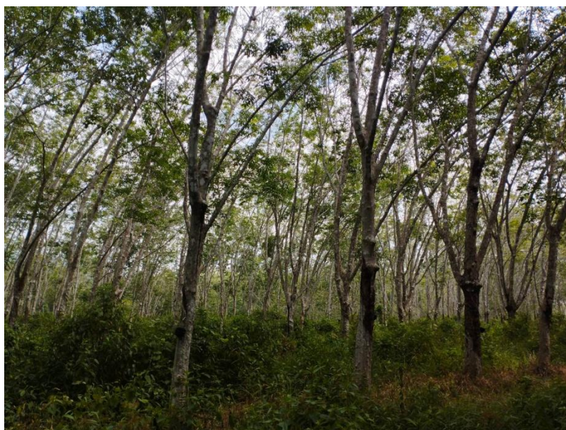
ภาพที่ 1 : ลักษณะสวนยางพารา SFC 0770 จังหวัดสงขลา

ผลการสำรวจความหลากหลายทางชีวภาพพรรณพืช บริเวณพื้นที่สวนยางพารา SFC 0770 จังหวัดสงขลา พบว่าเป็นสวนยางพารา(Genus) : Hevea สปีชีส์ (Species): brasiliensis ชื่อสามัญ (Common name) : para rubber ชื่อวิทยาศาสตร์ (Scientific name) : Hevea brasiliensis Mull-Arg. กระจายอยู่ทั่วไป (ภาพที่ 1)