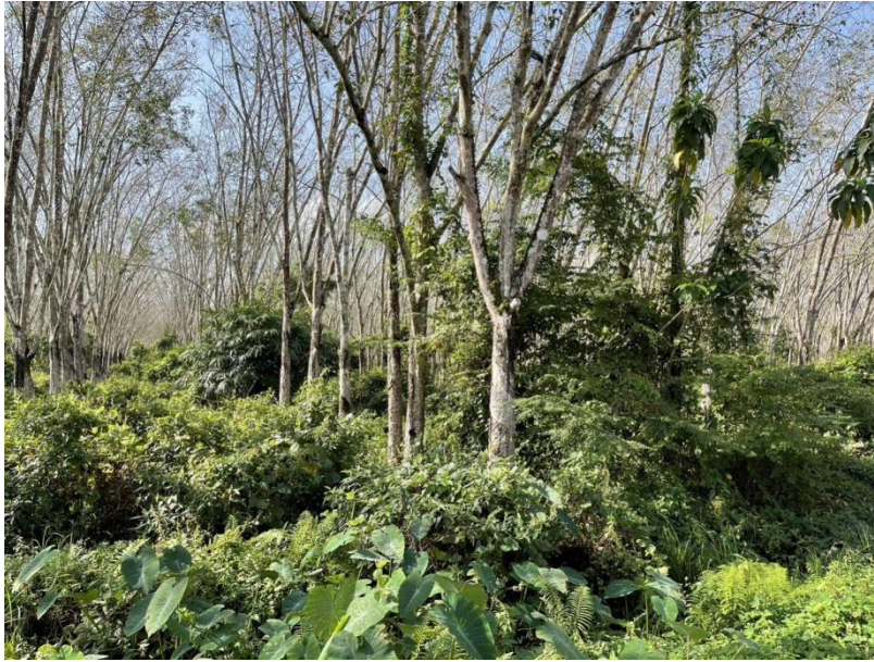
ภาพที่ 1 : ลักษณะสวนยางพารา SFC 0748 จังหวัดสงขลา