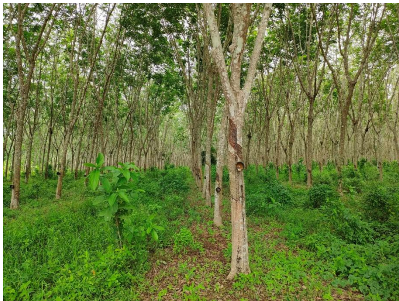
ภาพที่ 1 : ลักษณะสวนยางพารา SFC 0779 จังหวัดสงขลา

ผลการสำรวจความหลากหลายทางชีวภาพพรรณพืช บริเวณพื้นที่สวนยางพารา SFC 0779 จังหวัดสงขลา พบว่าเป็นสวนยางพารา(Genus) : Hevea สปีชีส์ (Species): brasiliensis ชื่อสามัญ (Common name) : para rubber ชื่อวิทยาศาสตร์ (Scientific name) : Hevea brasiliensis Mull-Arg. กระจายอยู่ทั่วไป (ภาพที่ 1)