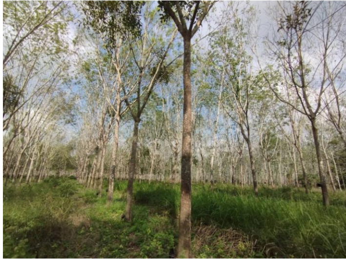
ภาพที่ 1 : ลักษณะสวนยางพารา SFC 0760 จังหวัดสงขลา