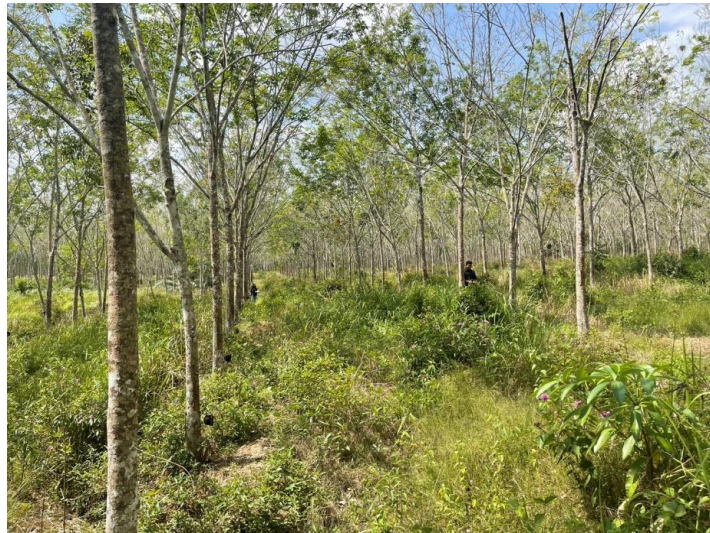
ภาพที่ 1 : ลักษณะสวนยางพารา SFC 0761 จังหวัดสงขลา

ผลการสำรวจความหลากหลายทางชีวภาพพรรณพืช บริเวณพื้นที่สวนยางพารา SFC 0761 จังหวัดสงขลา พบว่าเป็นสวนยางพารา(Genus) : Hevea สปีชีส์ (Species): brasiliensis ชื่อสามัญ (Common name) : para rubber ชื่อวิทยาศาสตร์ (Scientific name) : Hevea brasiliensis Mull-Arg. กระจายอยู่ทั่วไป (ภาพที่ 1)