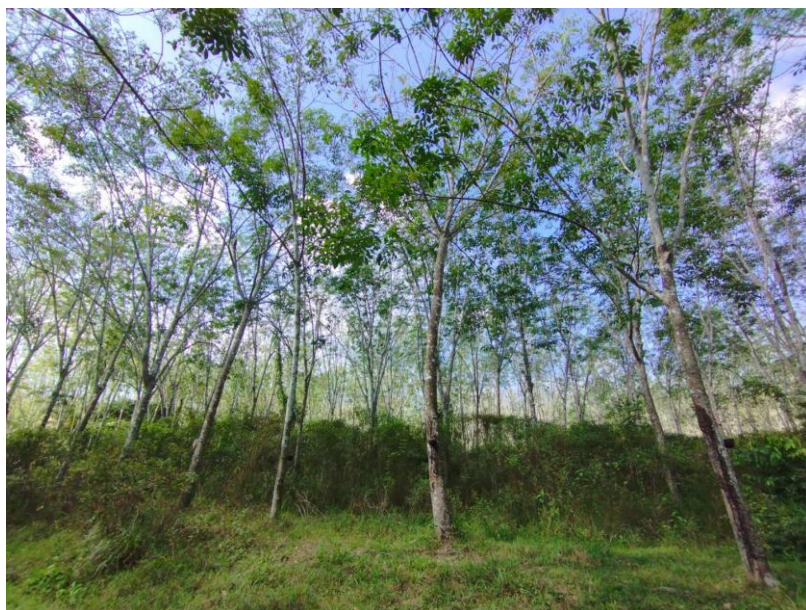
ภาพที่ 1 : ลักษณะสวนยางพารา SFC 0765 จังหวัดสงขลา

ผลการสำรวจความหลากหลายทางชีวภาพพรรณพืช บริเวณพื้นที่สวนยางพารา SFC 0765 จังหวัดสงขลา พบว่าเป็นสวนยางพารา(Genus) : Hevea สปีชีส์ (Species): brasiliensis ชื่อสามัญ (Common name) : para rubber ชื่อวิทยาศาสตร์ (Scientific name) : Hevea brasiliensis Mull-Arg. กระจายอยู่ทั่วไป (ภาพที่ 1)