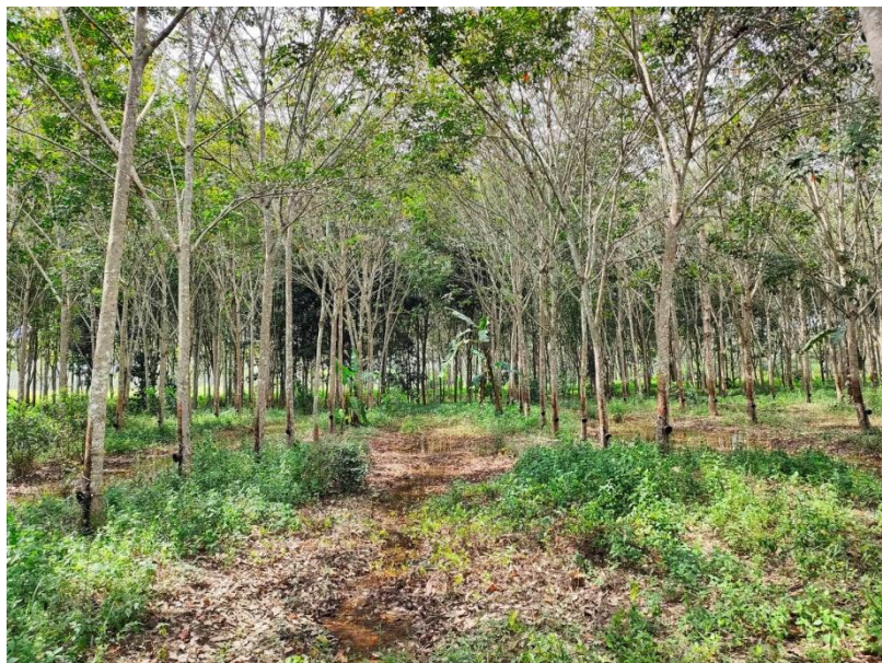
ภาพที่ 1 : ลักษณะสวนยางพารา SFC 0803 จังหวัดสงขลา

ผลการสำรวจความหลากหลายทางชีวภาพพรรณพืช บริเวณพื้นที่สวนยางพารา SFC 0803 จังหวัดสงขลา พบว่าเป็นสวนยางพารา(Genus) : Hevea สปีชีส์ (Species): brasiliensis ชื่อสามัญ (Common name) : para rubber ชื่อวิทยาศาสตร์ (Scientific name) : Hevea brasiliensis Mull-Arg. กระจายอยู่ทั่วไป (ภาพที่ 1)