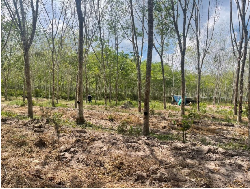
ภาพที่ 1 : ลักษณะสวนยางพารา SFC 0753 จังหวัดสงขลา