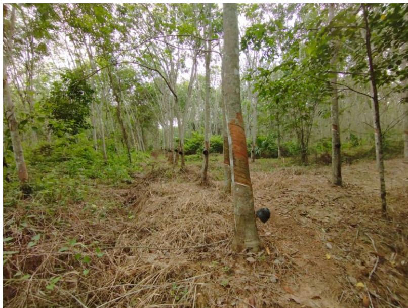
ภาพที่ 1 : ลักษณะสวนยางพารา SFC 0764 จังหวัดสงขลา

ผลการสำรวจความหลากหลายทางชีวภาพพรรณพืช บริเวณพื้นที่สวนยางพารา SFC 0764 จังหวัดสงขลา พบว่าเป็นสวนยางพารา(Genus) : Hevea สปีชีส์ (Species): brasiliensis ชื่อสามัญ (Common name) : para rubber ชื่อวิทยาศาสตร์ (Scientific name) : Hevea brasiliensis Mull-Arg. กระจายอยู่ทั่วไป (ภาพที่ 1)