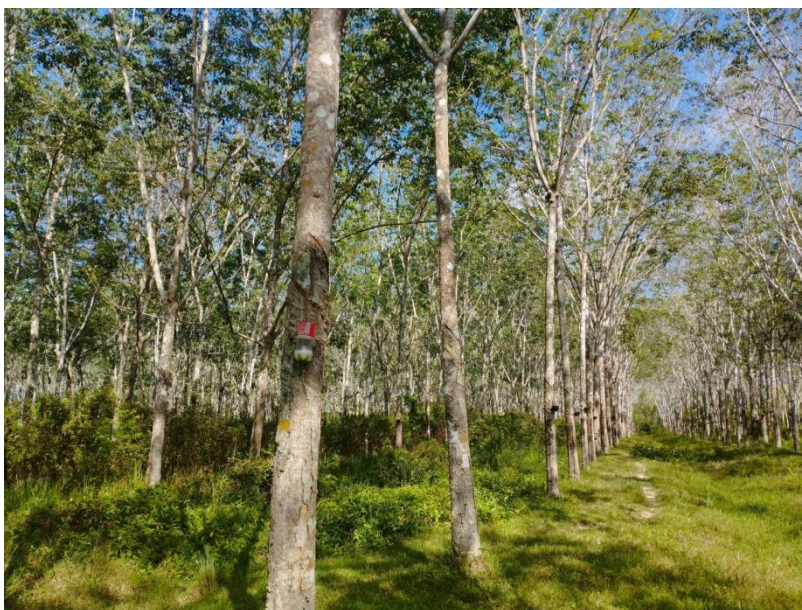
ภาพที่ 1 : ลักษณะสวนยางพารา SFC 0767 จังหวัดสงขลา

ผลการสำรวจความหลากหลายทางชีวภาพพรรณพืช บริเวณพื้นที่สวนยางพารา SFC 0767 จังหวัดสงขลา พบว่าเป็นสวนยางพารา(Genus) : Hevea สปีชีส์ (Species): brasiliensis ชื่อสามัญ (Common name) : para rubber ชื่อวิทยาศาสตร์ (Scientific name) : Hevea brasiliensis Mull-Arg. กระจายอยู่ทั่วไป (ภาพที่ 1)