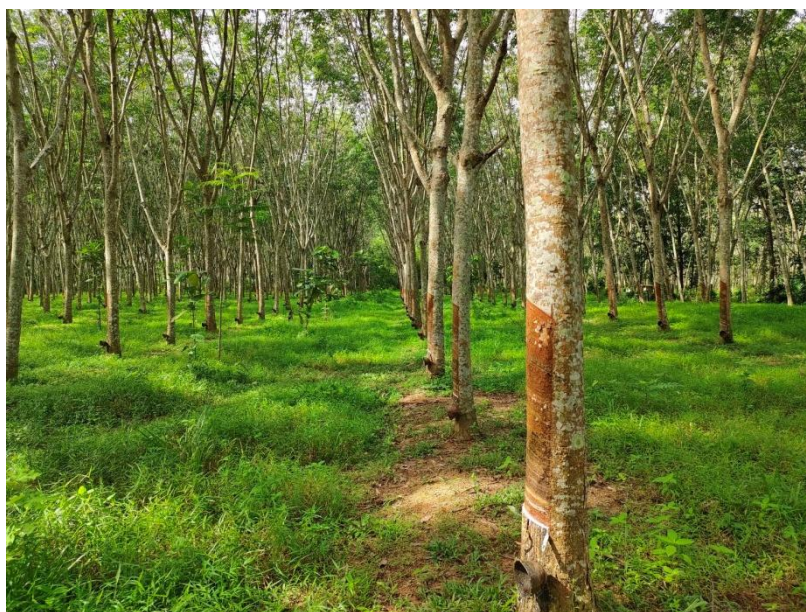
ภาพที่ 1 : ลักษณะสวนยางพารา SFC 0774 จังหวัดสงขลา

ผลการสำรวจความหลากหลายทางชีวภาพพรรณพืช บริเวณพื้นที่สวนยางพารา SFC 0774 จังหวัดสงขลา พบว่าเป็นสวนยางพารา(Genus) : Hevea สปีชีส์ (Species): brasiliensis ชื่อสามัญ (Common name) : para rubber ชื่อวิทยาศาสตร์ (Scientific name) : Hevea brasiliensis Mull-Arg. กระจายอยู่ทั่วไปแปลง (ภาพที่ 1)