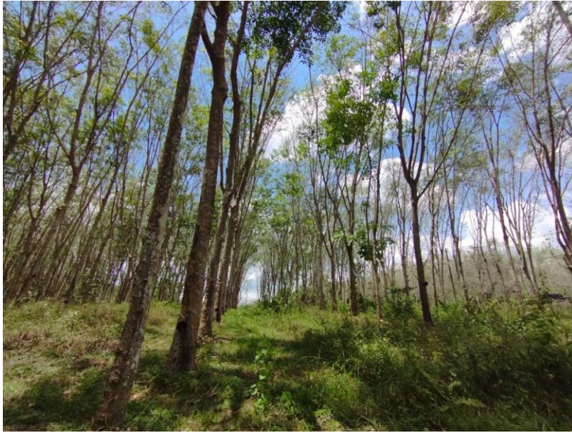
ภาพที่ 1 : ลักษณะสวนยางพารา SFC 0755 จังหวัดสงขลา