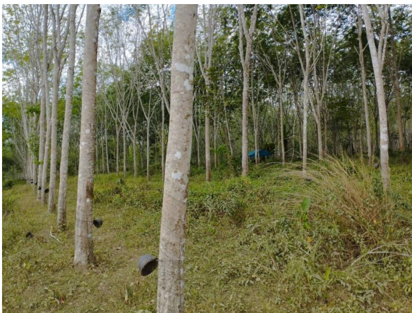
ภาพที่ 1 : ลักษณะสวนยางพารา SFC 0759 จังหวัดสงขลา

ผลการสำรวจความหลากหลายทางชีวภาพพรรณพืช บริเวณพื้นที่สวนยางพารา SFC 0759 จังหวัดสงขลา พบว่าเป็นสวนยางพารา(Genus) : Hevea สปีชีส์ (Species): brasiliensis ชื่อสามัญ (Common name) : para rubber ชื่อวิทยาศาสตร์ (Scientific name) : Hevea brasiliensis Mull-Arg. กระจายอยู่ทั่วไป (ภาพที่ 1)