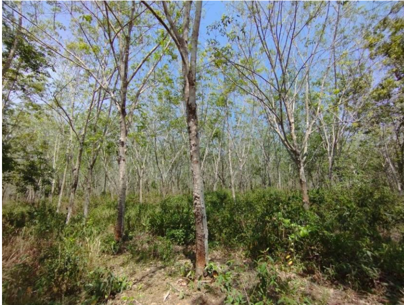
ภาพที่ 1 : ลักษณะสวนยางพารา SFC 0756 จังหวัดสงขลา