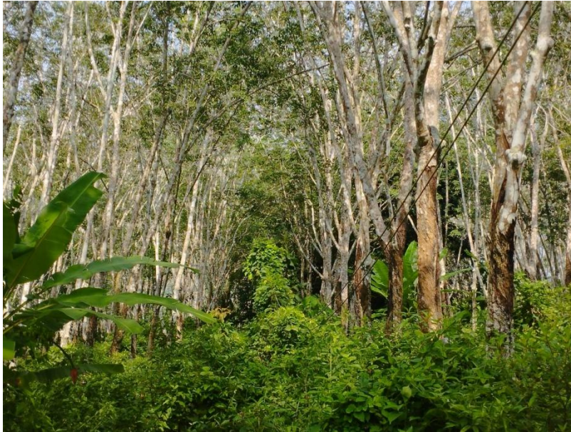
ภาพที่ 1 : ลักษณะสวนยางพารา SFC 0791 จังหวัดสงขลา

ผลการสำรวจความหลากหลายทางชีวภาพพรรณพืช บริเวณพื้นที่สวนยางพารา SFC 0791 จังหวัดสงขลา พบว่าเป็นสวนยางพารา(Genus) : Hevea สปีชีส์ (Species): brasiliensis ชื่อสามัญ (Common name) : para rubber ชื่อวิทยาศาสตร์ (Scientific name) : Hevea brasiliensis Mull-Arg. กระจายอยู่ทั่วไป (ภาพที่ 1)