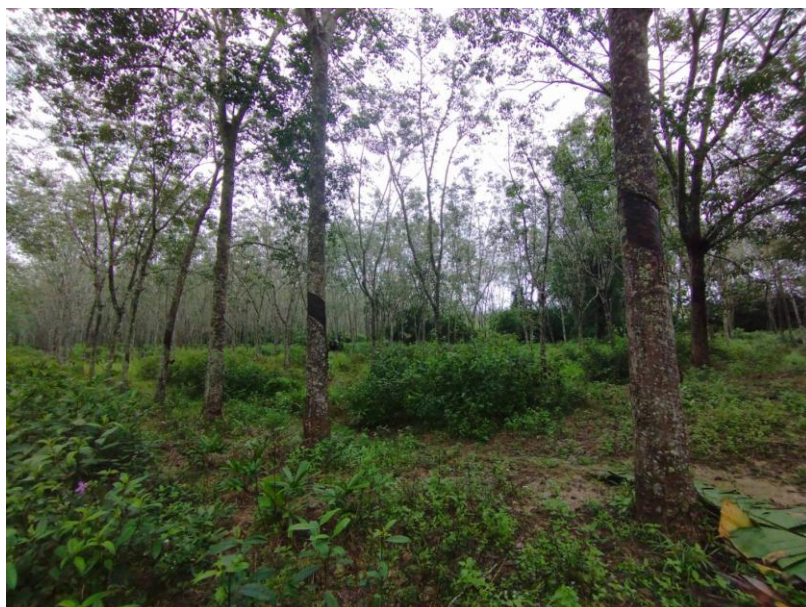
ภาพที่ 1 : ลักษณะสวนยางพารา SFC 0807 จังหวัดสงขลา

ผลการสำรวจความหลากหลายทางชีวภาพพรรณพืช บริเวณพื้นที่สวนยางพารา SFC 0807 จังหวัดสงขลา พบว่าเป็นสวนยางพารา(Genus) : Hevea สปีชีส์ (Species): brasiliensis ชื่อสามัญ (Common name) : para rubber ชื่อวิทยาศาสตร์ (Scientific name) : Hevea brasiliensis Mull-Arg. กระจายอยู่ทั่วไป (ภาพที่ 1)