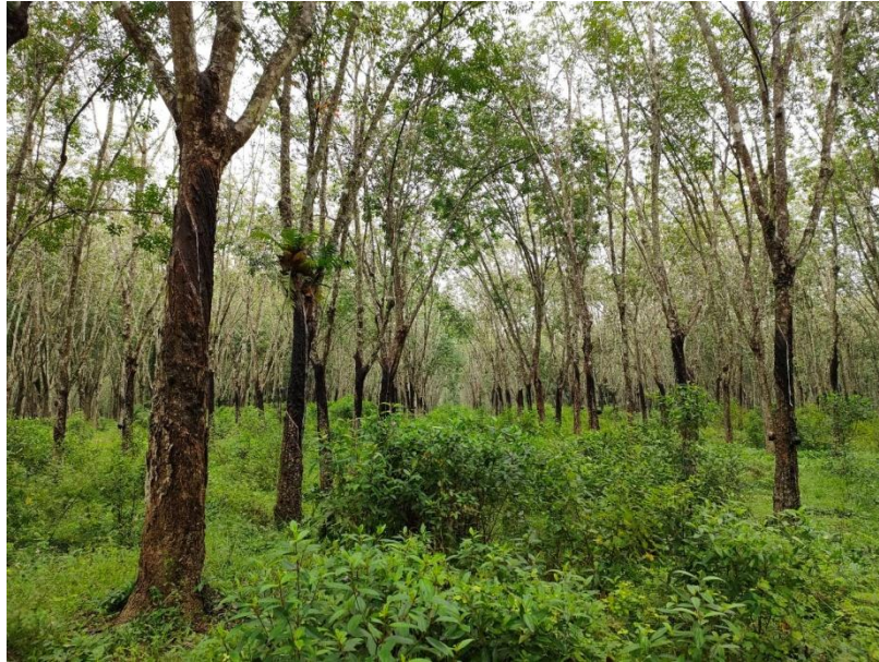
ภาพที่ 1 : ลักษณะสวนยางพารา SFC 0806 จังหวัดสงขลา

ผลการสำรวจความหลากหลายทางชีวภาพพรรณพืช บริเวณพื้นที่สวนยางพารา SFC 0806 จังหวัดสงขลา พบว่าเป็นสวนยางพารา(Genus) : Hevea สปีชีส์ (Species): brasiliensis ชื่อสามัญ (Common name) : para rubber ชื่อวิทยาศาสตร์ (Scientific name) : Hevea brasiliensis Mull-Arg. กระจายอยู่ทั่วไป (ภาพที่ 1)