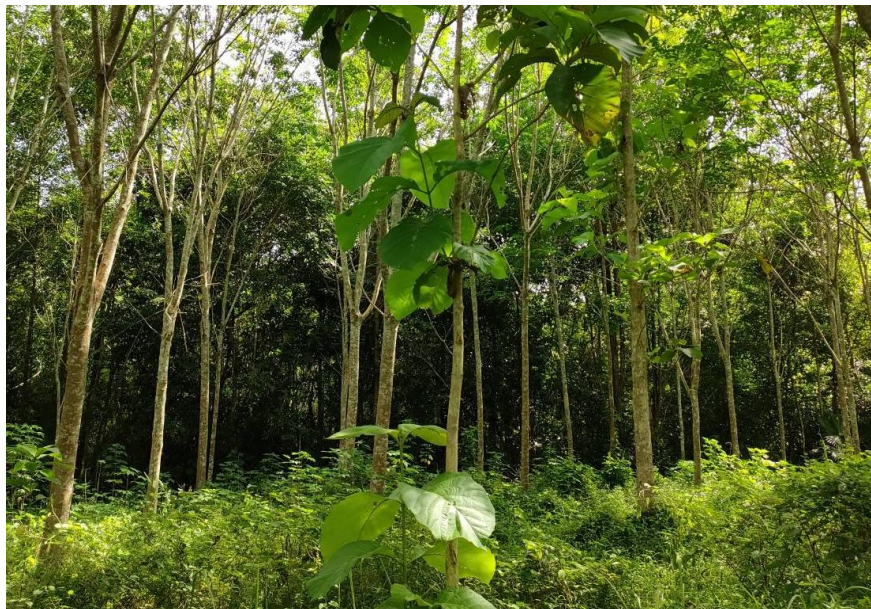
ภาพที่ 1 : ลักษณะสวนยางพารา SFC 0763 จังหวัดสงขลา

ผลการสำรวจความหลากหลายทางชีวภาพพรรณพืช บริเวณพื้นที่สวนยางพารา SFC 0763 จังหวัดสงขลา พบว่าเป็นสวนยางพารา(Genus) : Hevea สปีชีส์ (Species): brasiliensis ชื่อสามัญ (Common name) : para rubber ชื่อวิทยาศาสตร์ (Scientific name) : Hevea brasiliensis Mull-Arg. กระจายอยู่ทั่วไป (ภาพที่ 1)