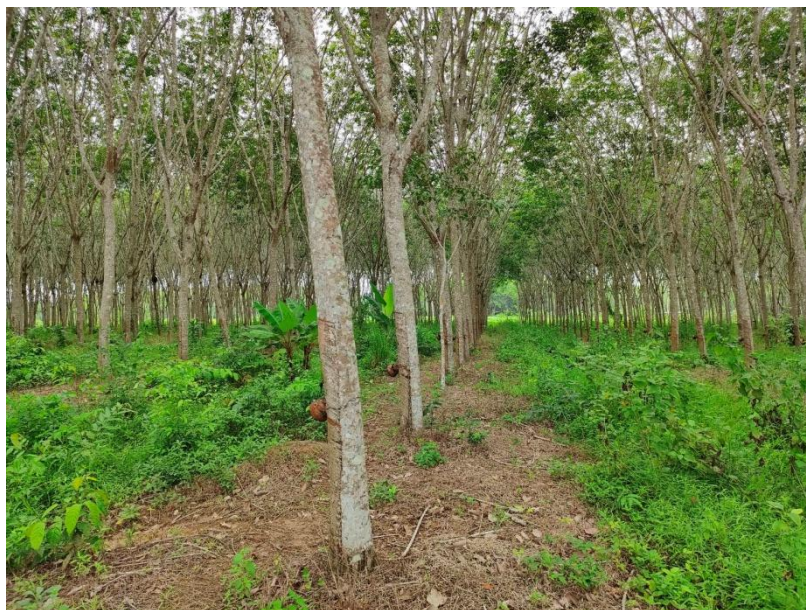
ภาพที่ 1 : ลักษณะสวนยางพารา SFC 0778 จังหวัดสงขลา

ผลการสำรวจความหลากหลายทางชีวภาพพรรณพืช บริเวณพื้นที่สวนยางพารา SFC 0778 จังหวัดสงขลา พบว่าเป็นสวนยางพารา(Genus) : Hevea สปีชีส์ (Species): brasiliensis ชื่อสามัญ (Common name) : para rubber ชื่อวิทยาศาสตร์ (Scientific name) : Hevea brasiliensis Mull-Arg. กระจายอยู่ทั่วไป (ภาพที่ 1)