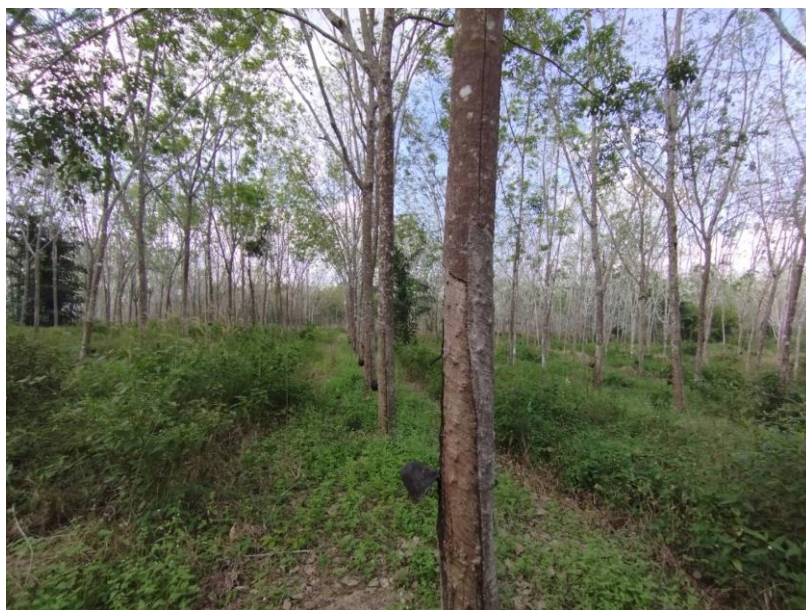
ภาพที่ 1 : ลักษณะสวนยางพารา SFC 0762 จังหวัดสงขลา

ผลการสำรวจความหลากหลายทางชีวภาพพรรณพืช บริเวณพื้นที่สวนยางพารา SFC 0762 จังหวัดสงขลา พบว่าเป็นสวนยางพารา(Genus) : Hevea สปีชีส์ (Species): brasiliensis ชื่อสามัญ (Common name) : para rubber ชื่อวิทยาศาสตร์ (Scientific name) : Hevea brasiliensis Mull-Arg. กระจายอยู่ทั่วไป (ภาพที่ 1)