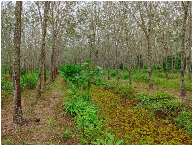
ภาพที่ 1 : ลักษณะสวนยางพารา SFC 0808 จังหวัดสงขลา

ผลการสำรวจความหลากหลายทางชีวภาพพรรณพืช บริเวณพื้นที่สวนยางพารา SFC 0808 จังหวัดสงขลา พบว่าเป็นสวนยางพารา(Genus) : Hevea สปีชีส์ (Species): brasiliensis ชื่อสามัญ (Common name) : para rubber ชื่อวิทยาศาสตร์ (Scientific name) : Hevea brasiliensis Mull-Arg. กระจายอยู่ทั่วไป (ภาพที่ 1)