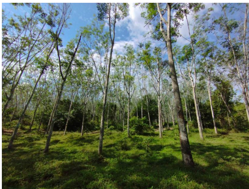
ภาพที่ 1 : ลักษณะสวนยางพารา SFC 0766 จังหวัดสงขลา

ผลการสำรวจความหลากหลายทางชีวภาพพรรณพืช บริเวณพื้นที่สวนยางพารา SFC 0766 จังหวัดสงขลา พบว่าเป็นสวนยางพารา(Genus) : Hevea สปีชีส์ (Species): brasiliensis ชื่อสามัญ (Common name) : para rubber ชื่อวิทยาศาสตร์ (Scientific name) : Hevea brasiliensis Mull-Arg. กระจายอยู่ทั่วไป (ภาพที่ 1)