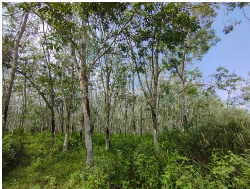
ภาพที่ 1 : ลักษณะสวนยางพารา SFC 0790 จังหวัดสงขลา

ผลการสำรวจความหลากหลายทางชีวภาพพรรณพืช บริเวณพื้นที่สวนยางพารา SFC 0790 จังหวัดสงขลา พบว่าเป็นสวนยางพารา(Genus) : Hevea สปีชีส์ (Species): brasiliensis ชื่อสามัญ (Common name) : para rubber ชื่อวิทยาศาสตร์ (Scientific name) : Hevea brasiliensis Mull-Arg. กระจายอยู่ทั่วไป (ภาพที่ 1)