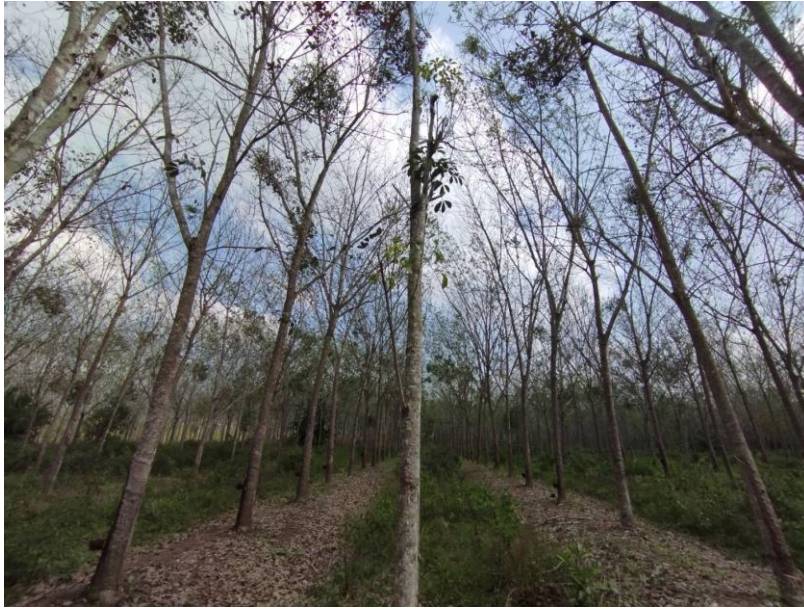
ภาพที่ 1 : ลักษณะสวนยางพารา SFC 0757 จังหวัดสงขลา