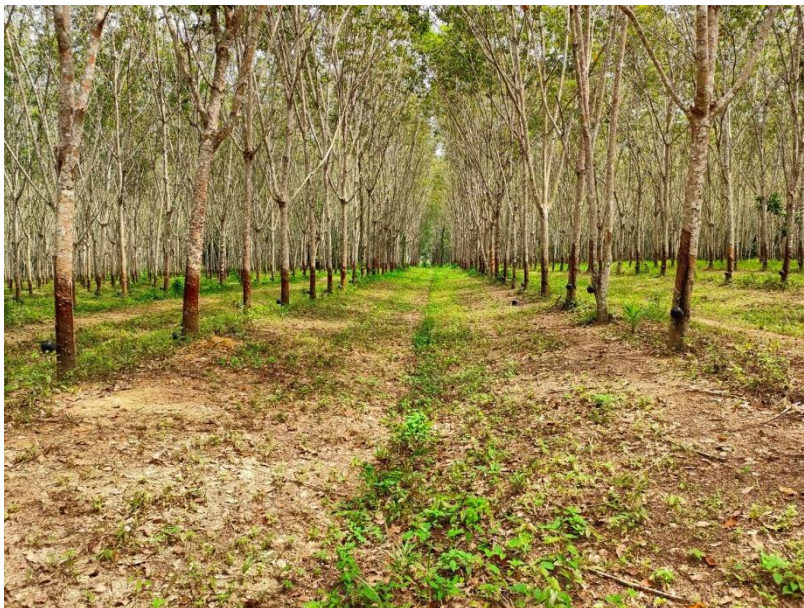
ภาพที่ 1 : ลักษณะสวนยางพารา SFC 0788 จังหวัดสงขลา

ผลการสำรวจความหลากหลายทางชีวภาพพรรณพืช บริเวณพื้นที่สวนยางพารา SFC 0788 จังหวัดสงขลา พบว่าเป็นสวนยางพารา(Genus) : Hevea สปีชีส์ (Species): brasiliensis ชื่อสามัญ (Common name) : para rubber ชื่อวิทยาศาสตร์ (Scientific name) : Hevea brasiliensis Mull-Arg. กระจายอยู่ทั่วไป (ภาพที่ 1)